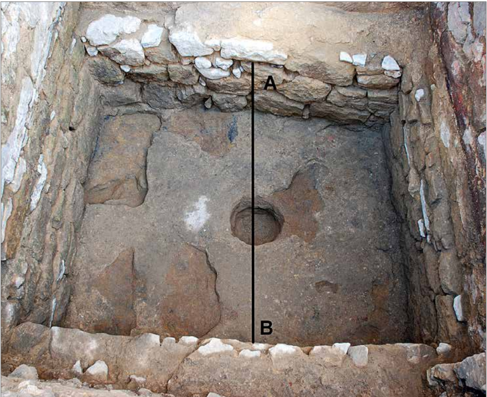
Obr. 5. Púdorys podlahy schodišťové věže.