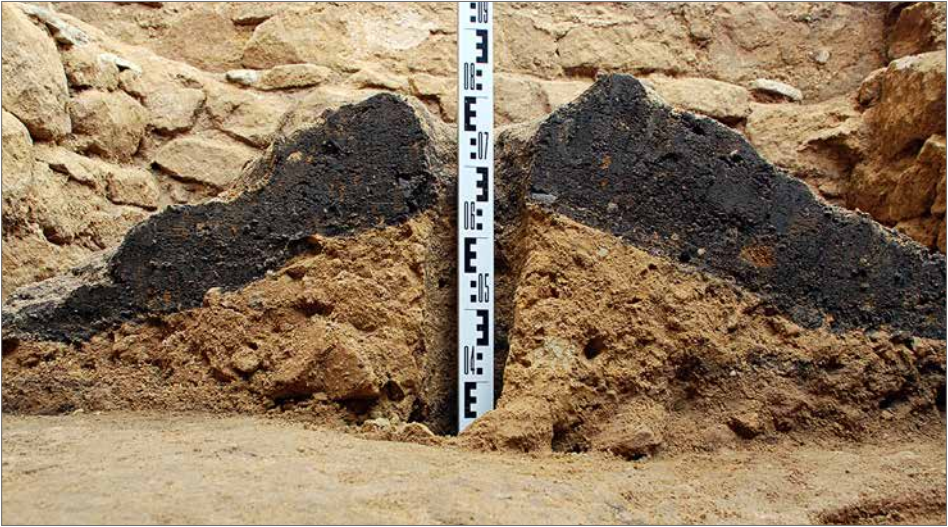
Obr. 4. Řez kúlovou jamkou.