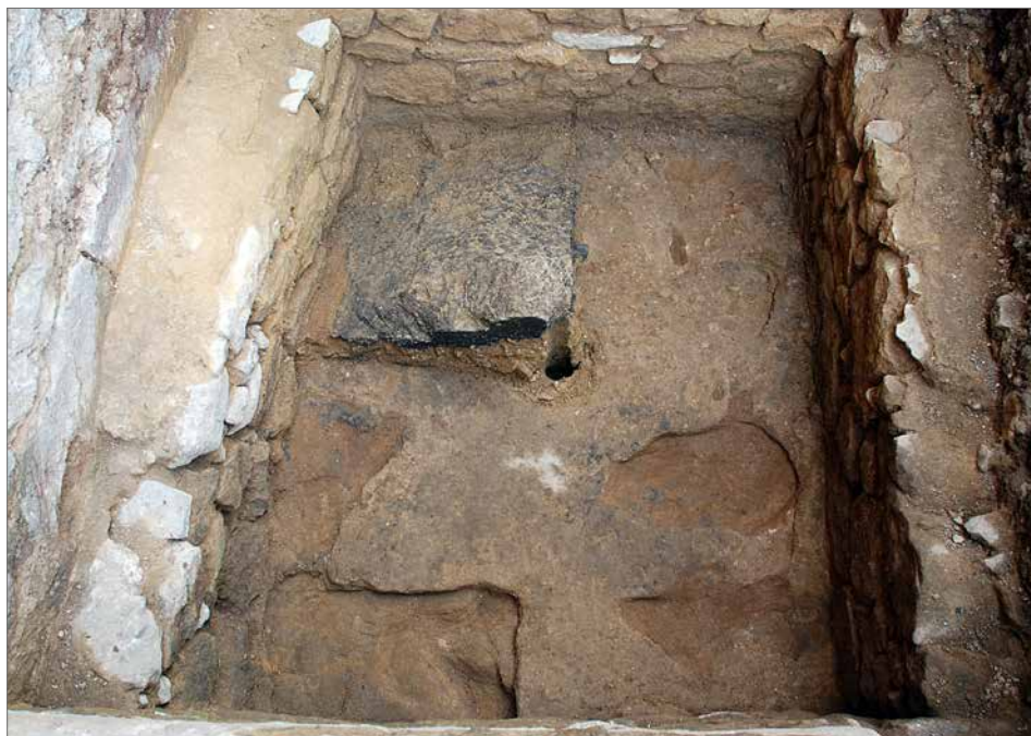
Obr. 3. Půdorys podlahy schodišťové věže.