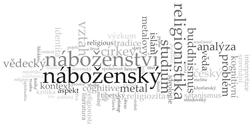
Obr. 3: Wordcloud nejfrekventovaněji využívaných slov v nadpisech článků, esejů, polemik a zpráv publikovaných v Sacra (2003–2021).

Když bychom, jako v každém správném nahlédnutí do minulosti, pokračovali v pátrání ve světě čísel, našli bychom, že v Sacra se za dobu 2003–2021 vytisklo celkově neuvěřitelných 3222 stran textu s celkovým počtem 204 autorů . Na těchto několika tisících stran si naši čtenáři mohli přečíst celkem 371 textů : 158 článků, esejů a polemik, 14 rozhovorů, 83 recenzí a 116 zpráv (viz Obr. 4). K akademickým textům pak přibýly také 4 ankety mezi studenty, 7 religionistických komiksů a jedna krátká sbírka básní.