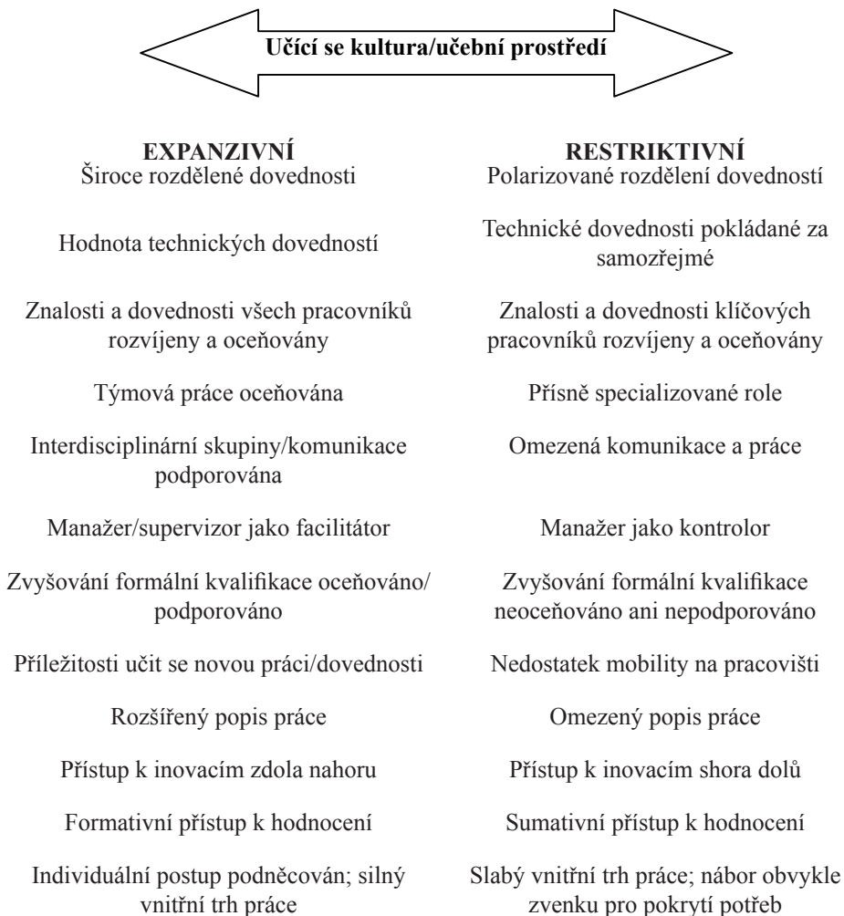
Schéma 3: Učíci se kultura/učební prostředí (Evans a kol., 2006, s. 61)

Charakteristiky učebního prostředí (či učící se kultury, tj. organizační kultury ve vztahu k učení) jsou uvedeny jako extrémní kontinua od expanzivního po restriktivní přístup k učení. Cílem autorů (Evans a kol., 2006) při konceptualizaci expanzivního a restriktivního přístupu k učení bylo identifikovat znaky prostředí nebo pracovní situace, které ovlivňují, jak dalece pracoviště jako celek vytváří příležitosti a naopak bariéry k učení. Umístění dané organizační kultury na této škále určuje, do jaké míry je učení podporováno. Na základě zmíněných charakteristik je patrné, že čím více se daná organizace blíží k expanzivnímu konci škály, tím více je učení podporováno. Avšak nelze tvrdit, že po vytvoření expanzivnějšího učebního prostředí automaticky vzniknou nové formy práce a učení. Empirickým výzkumem jen bylo zjištěno, že expanzivní přístup k rozvoji pracovníků pravděpodobně zvyšuje kvantitu a rozsah příležitostí k participaci a tedy k učení.