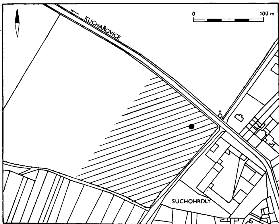
Obr. 1. Kuchařovice, okr. Znojmo. Místo výzkumu v poloze „Dolní Kasperek“. (Kresba: M. Bálek)

Při rozrušení jámy radlicí pluhu došlo také k promíšení materiálu, takže v prvních dvou vrstvách byly kromě předmětů MMK také střepy LK, středověké střepy, novověké střepy a recentní předměty z povrchu. Ve spodní části jámy (zachyceno „in situ“) pak byly střepy MMK a LK. Podle utváření spodní části a dna se jednalo o mísovité zahloubenou jámu o průměru asi 1 m.