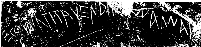
Abb. 3: Urna Tita Vendias