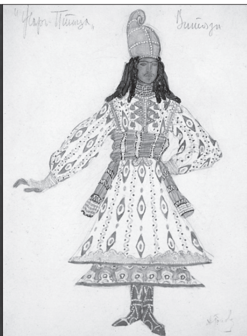
A. Golovin: Návrh kostýmu a jeho realizace v inscenaci Stravinského Ptáka-Ohniváka , 1910.