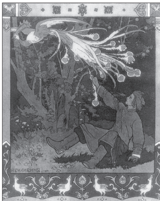
I. Bilibin: Carevič Ivan a Pták ohnivák. Ilustrace k pohádce, 1899.

M. M. Fokin versus V. F. Nižinský – odlišné pojetí mizanscény, konfrontace secesních póz ( Pták-Ohnivák ) a prvních náznaků konstruktivisticky řešeného pohybu ( Faunovo pozdní odpoledne )