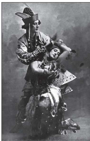
M. M. Fokin a T. P. Karsavina v Ptáku-Ohniváku , dobová fotografie 1910.

M. M. Fokin versus V. F. Nižinský – odlišné pojetí mizanscény, konfrontace secesních póz ( Pták-Ohnivák ) a prvních náznaků konstruktivisticky řešeného pohybu ( Faunovo pozdní odpoledne )