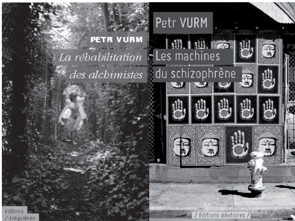
Couvertures de livres «taillés sur mesure»

Pourtant, une question cruciale est suscitée par les générateurs automatiques. Dans son approche la plus générale, cette question tourne autour de la signification. Comment l'auteur de l'algorithme littéraire peut-il imposer du sens à ce qui est généré de façon combinatoire? Même s'il est facile de produire une quantité énorme de textes par la machine, le plus grand défi consiste à choisir ceux qui enrichissent le lecteur du point de vue esthétique, intellectuel, narratif, etc. Pour les genres lyriques, il s'agirait surtout de maintenir une isotopie de l'énonciation totale qui s'allie à l'originalité de la combinaison des rimes, pour les genres narratifs, c'est surtout le respect de la chronologie et de la causalité qui pose des problèmes.