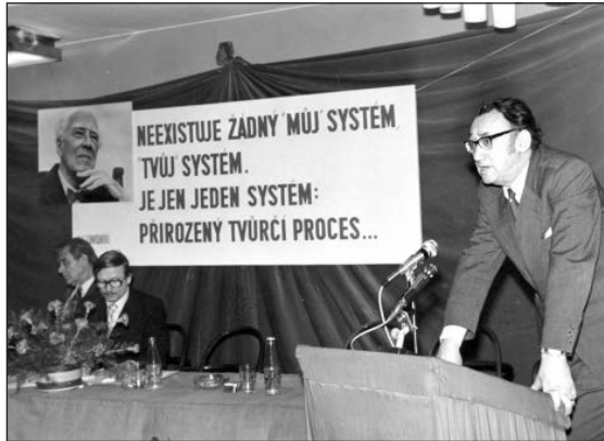
Obr. 5. Blíže neurčená konference, nedat.