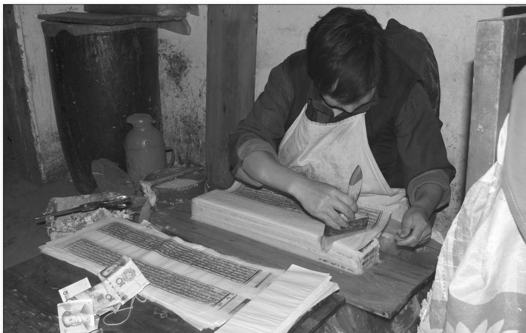
Obr. 4: Lepení vytištěných listů knih v klášteře Labrang