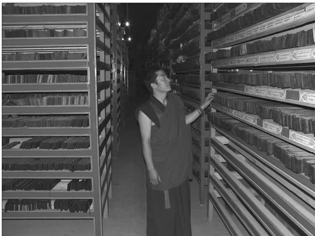
Obr. 2: Dřevěné matrice pro tištění knih v tiskárně kláštera Labrang

Část fotografií byla pořízená v případě, kdy tiskaři slíbili vytisknout knihu v určitém čase (za dva týdny). Nicméně po dvou týdnech se nestalo nic. Tiskař se omluvil, a poté, co shledal, že mi na věci záleží, vyzval mě k tomu, abych mu pomohl text ještě ten večer vytisknout. V knihovně jsme v noci našli potřebné matrice a já posléze jen skládal jeho