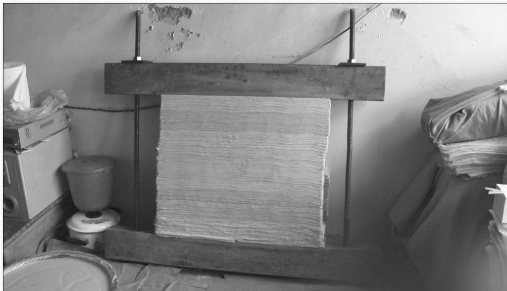
Obr. 6: Lisování knih před obarvením ořízky (Labrang, foto: autor 2007)