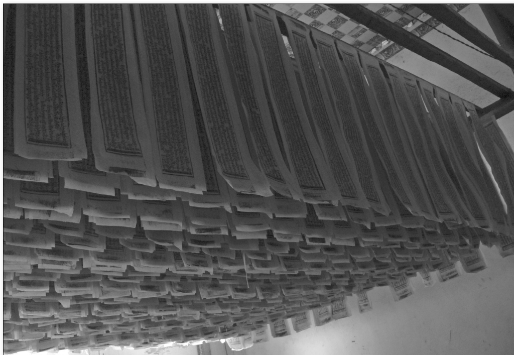
Obr. 5: Sušení slepených listů knih (Labrang, foto: autor 2007)