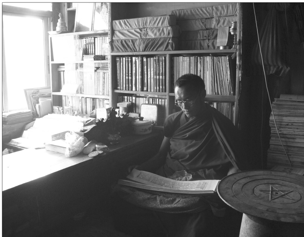
Obr. 1: Tibetský učitel před svoji knihovnou (Ngawa 2007).

Takový paradox je obecného rázu, je však nejlépe prokazatelný na tantrických textech, ve kterých je ukryté napětí mezi psaným textem a ústní tradicí již z indického prostředí. Právě tantrické rituální texty vyžadují i nezapsané výklady mistra, přesto lze pozorovat tendenci je zapisovat již od 11. století. Tato tendence později ještě zesílí zejména v obrovských klášterních školách, kde vznikla potřeba učebních textů pro značný počet mnichů, ke kterým nebylo možné přistupovat individuálně.