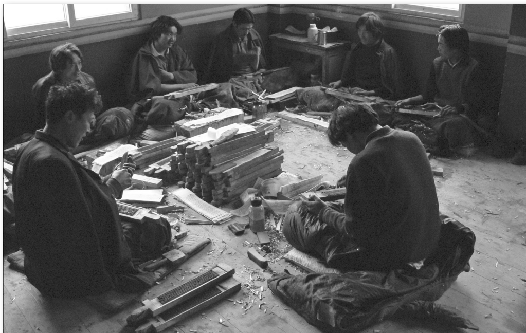
Obr. 3: Vyřezávání nových matic pro tištění knih (klášter Päljul, Kham)