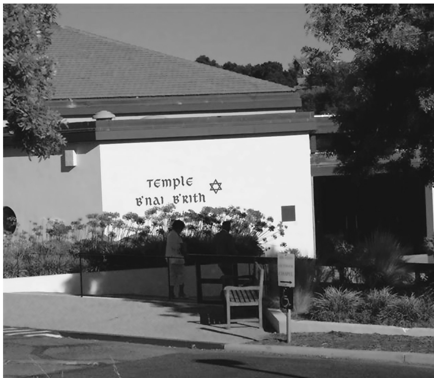
Obr. č. 13: Svatostánky slouží často jako školy, sociální centra, místa každodenního setkávání či kulturní centra, Centrum komunity B'nai B'rith, Santa Barbara (CA).

kdy byl „katolický“ prezident John Fitzgerald Kennedy obviňován z toho, že jako katolík musí být poslušný Vatikánu a uvrhne Spojené státy do područí nejvyšší katolické hierarchie. V této souvislosti je ale třeba říci, že princip kongregacionalismu a relativně vysoké míry lokální autonomie respektuje v mnoha ohledech i sama katolická církev.