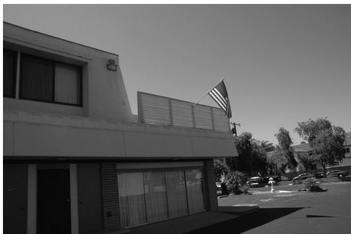
Obr. č. 9: Nezbytnou součástí většiny amerických svatostánků je americká vlajka – katolický kostel, Goleta (CA).

Výše uvedené ale neznamená, že náboženství je ve Spojených státech „drženo“ mimo veřejný prostor. Jde spíše o institucionální vymezení hranic mezi světským a náboženským. Ve veřejném prostoru naopak hraje náboženství významnou roli, která bývá mnohdy používána jako příklad zpochybňování tzv. sekularizační teze (= sociologický koncept, podle kterého je sekularizace, tedy proces postupné marginalizace náboženství, nedílnou a nutnou součástí procesu modernizace). Projevy „veřejné důležitosti“ náboženství jsou velmi různorodé a jsou s nimi spojené i různé důvody a konsekvence. Např. známý nápis „ In God we trust “ se na dolarových bankovkách objevil až v průběhu 50. let 20. století jako důsledek stupňující se studené války spojený se snahou ukázat „pravdivost“ a oprávněnost politických postojů Spojených států. Jiným příkladem „veřejné prezentace“ nábo-