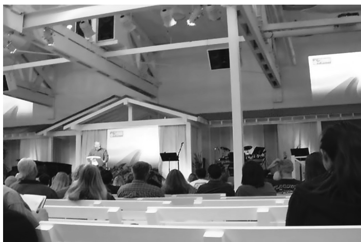
Obr. č. 14: Typická bohoslužba v jedné z kalifornských megacírkví, jejíž součástí je rocková kapela, používání audio-vizuálních prostředků a kázání mající podobu show. Kongregace Calvary Chapel, Goleta (CA).

Jedním z typických rysů či dopadů této charakteristiky je snaha co možná nejvíce re-agovat na potřeby společnosti/komunity , což se úzce dotýká nejen již několikrát zmiňované veřejné role náboženství, ale také jeho aktivismu, o němž bude zmínka později. Tyto skutečnosti se pak podílejí na mnoha projevech amerického náboženství, které bývají vnějšími pozorovateli interpretovány poměrně negativně. Určitě mezi ně patří tendence k masifikaci a „zábavnému“ náboženství . Nejde přitom jen o soudobé tendence, které kanadský sociolog náboženství David Lyon trefně označil za disneyzaci náboženství . 69