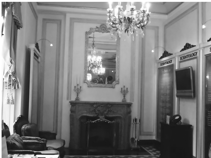
Obr. č. 19: Propojení náboženství a businessu je pro americkou religiozitu poměrně typické – Celebrity Center, Church of Scientology, Los Angeles (CA).

náboženské skupiny v USA nejsou něčím, co pouze reaguje na okolní situaci (politickou, sociální, ekonomickou, kulturní), ale v mnoha ohledech tento kontext vytváří , a to včetně potřeb, které se v něm objevují.