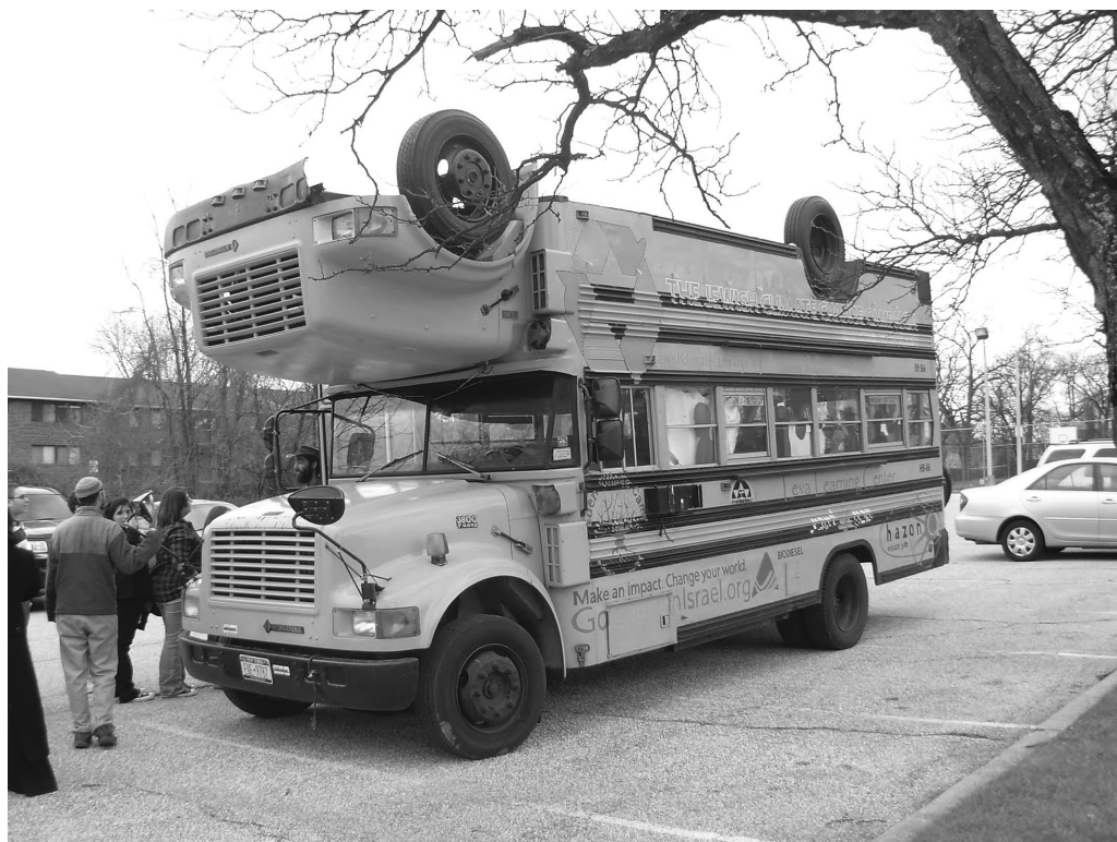
Obr. č. 17: Příklad environmentálního aktivismu i mezi „tradičními“ náboženskými skupinami. Podpora mezinárodního projektu The Jewish Climate Change Campaign hnutím Hazon. Zdroj: The Shoshana S. Cardin School . The Jewish Climate Change Campaign Comes to Cardin. In: Cake on Fridays [online] 30. 9. 2009. [vid. 2013-11-10]. Dostupné z http://cardinschoolblog.blogspot.cz/2009/11/jewish-climate-change-campaign-comes-to.html

Konkrétním projevem jsou pak takové fenomény jako již zmiňovaný televangelismus nebo další způsoby „upoutávání pozornosti“ pomocí šoku, symbolické zkratky či skandálu. Dobrým příkladem bylo mediálně skvěle zvládnuté a připravené vystoupení pastora Terryho Jonese, duchovního malé fundamentalistické skupiny působící na Floridě, který na 11. září 2010 vyhlásil „Mezinárodní den pálení Koránu“. Efekt této provokativní a kontroverzní akce byl mimořádný. Během několika dnů se stal Terry Jones mediální hvězdou a jeho kongregace, mající všeho všudy čtyřicet členů, jednou z nejznámějších ve Spojených státech. 71