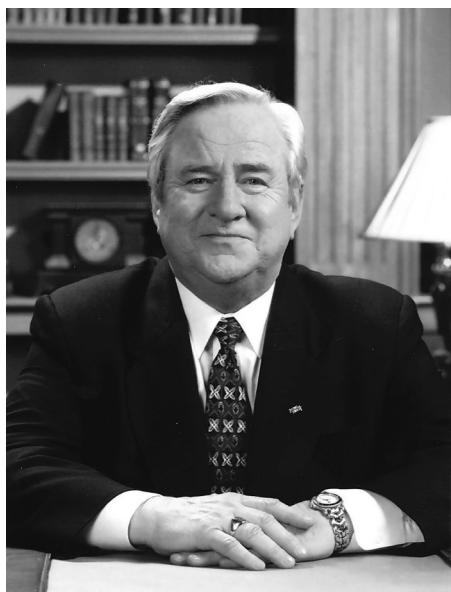
Obr. č. 15: Jerry Falwell zakladatel a jedna z nejvýznamnějších postav hnutí Morální většina. Zdroj: Liberty University. Jerry Falwell. In: Wikimedia Commons [online] 17. 7. 2011. [vid. 2013-11-10]. Pod licencí: Creative Commons Uveďte autora-Zachovejte licenci 3.0 Unported (viz http://creativecommons.org/licenses/by-sa/3.0/legalcode ). Dostupné z: http://commons.wikimedia.org/wiki/File:Jerry_Falwell_portrait.jpg?uselang=cs

rického politického proudu, který se velmi kriticky vymezoval vůči liberalismu a „úpadku“ americké společnosti v šedesátých a zejména sedmdesátých letech minulého století. Jeho představitelé, jako např. Jerry Falwell (1933–2007), kritizovali zejména odklon od základních principů křesťanské morálky , projevující se hlubokým morálním marasmem a nárůstem takových „patologických“ jevů, jako jsou pornografie, potraty a homosexualita. Všechny tyto „problémy“ byly interpretovány ze strany „ideologů“ Morální většiny jako doklad úpadku americké společnosti a „ porušení smlouvy s Bohem “, díky které jsou USA vyvolenou zemí. Jedinou možnou nápravou je proto návrat k „Boží smlouvě“ a obnovení křesťanského charakteru USA. Vrcholem aktivismu Morální většiny bylo přímé zapojení do prezidentské kampaně, v níž podpořila republikánského kandidáta Ronalda Reagana v roce 1980 (více viz kapitola č. IV Kulturní válka).