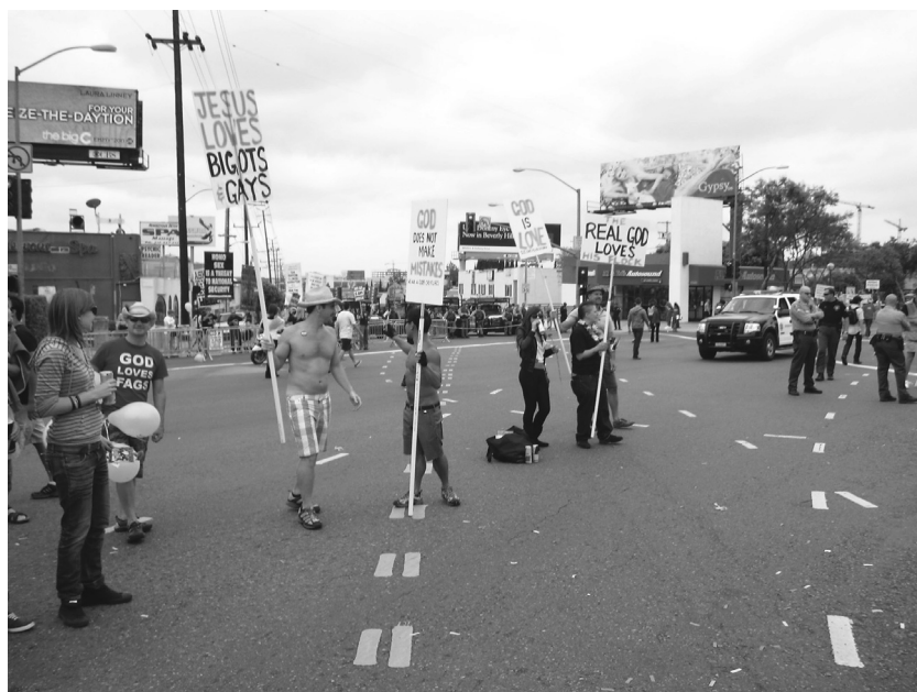
Obr. č. 16: Pochod křesťanských gay aktivistů. Grand Rapids, MI.

Výše uvedené příklady náboženského aktivismu nás přivádí k další „charakteristice“ náboženství ve Spojených státech, k jeho pragmatismu . Jako v mnoha dalších oblastech je i v případě náboženství typická tendence spojovat náboženské aktivity s konkrétními cíli a preferováním konkrétních přínosů či dopadů . V jistém smyslu slova můžeme v této souvislosti mluvit o instrumentalizaci náboženství , tedy o takovém pojetí náboženství, které ho chápe jako efektivní nástroj k prosazování konkrétních, často partiálních zájmů. Jedním z významných projevů pragmatismu americké religiozity je její schopnost pružně reagovat na situaci a tendence k maximalizaci efektivity . Spolu s populismem a aktivismem vede tento rys ke vzniku mnoha zajímavých, ale zároveň kontroverzních skutečností, jakými jsou například komercionalizace náboženství, vědomé a cílené používání marketingu při misijní činnosti, ale i při pastoraci, nebo snaha po maximálním využití potenciálu moderních masových médií.