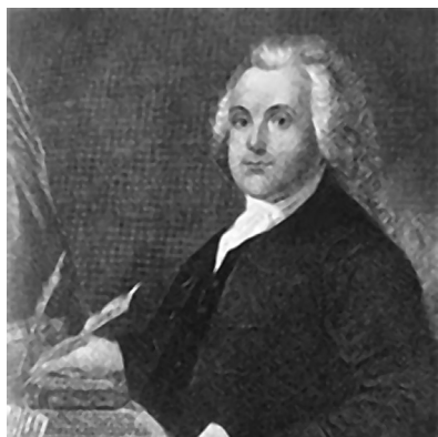
Obr. č. 7: Roger Williams (1603–1683), zakladatel státu Rhode Island. Zdroj: Roger Williams. In: Mystery History Reader [online] 28. 4. 2013. [vid. 2013-11-10]. Dostupné z: http://mysteryhistoryreader.com/2013/04/28/review-roger-williams-and-the-creation-of-the-american-soul-church-state-and-the-birth-of-liberty/

Tato charakteristika je zakotvena ve velkém důrazu na osobní svědomí, který je základem „amerického individualismu“. Svědomí je považováno za hlavní zdroj víry, ale i morálky. V jistém ohledu je tak možné mluvit o fenoménu sakralizace svědomí jako typickém projevu amerického způsobu života. Jedním z hlavních dopadů této sakralizace svědomí je důraz na svobodu náboženského vyznání, který se projevuje nejen v nedůvěře v instituci státní církve a vůbec v odmítnutí jakékoli intervence v oblasti náboženství ze strany státu (více viz oddělení státu a náboženství), ale také v důrazu na svobodu náboženského vyznání. Dobrou ilustrací tohoto faktu je vznik státu Rhode Island v roce 1636, který se zrodil jako důsledek snahy o naplnění maximální náboženské svobody. Jeho zakladatel, non-konformní teolog Roger Williams (1603–1683), opustil z důvodu neshody s jejím vedením puritánskou kolonii v Massachusetts a založil novou kolonii, do jejíhož zakládajícího dokumentu vložil zásadu náboženské svobody, kterou považoval za přirozený princip daný Boží vůlí. S podobným principem vznikaly i další kolonie, např. Pensylvánie (1681).