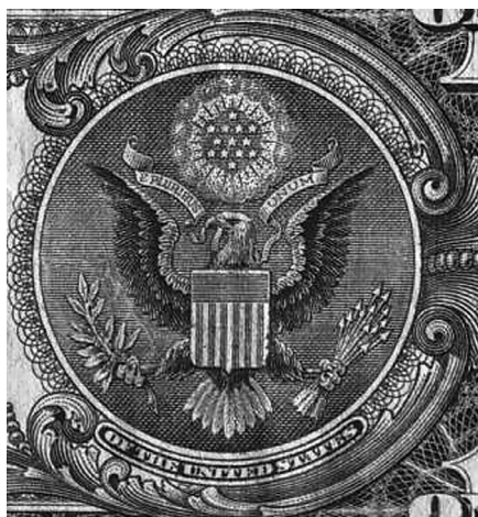
Obr. č. 6: Rub jednodolarové bankovky s tzv. Velkou pečetí Spojených států. Orel drží v zobáku mluvicí pásku s heslem E Pluribus Unum . Zdroj: GFCinthatorder. A Little History On The Dollar Bill . In: For God, Family, and Country [online] 5. 9. 2012. [vid. 2013-11-10]. Dostupné z: http://4gfc.wordpress.com/2012/09/05/a-little-history-on-the-dollar-bill/

V předchozí kapitole jsme se pokusili ukázat základní modely interpretace dějin amerického náboženství. I přes rozdílná východiska a přístupy, která jsou s jednotlivými modely, označovanými jako konsenzuální, konfliktualistické a kombinované paradigma, spojené, se přesto ukázalo jedno téma společné všem těmto přístupům. Tímto tématem a v jistém ohledu můžeme dokonce říci, že i klíčem k pochopení amerického náboženství, je fenomén pluralismu . Nejde však jen o téma či problém výsostně náboženský. Právě naopak. Pluralismus je jedním z ústředních témat i pro americkou kulturu, společnost a politiku. Ba co víc, je nedílnou součástí diskusí týkajících se americké identity, jejího vytváření a transformování. V této souvislosti je možné zmínit oficiální motto Spojených států – E pluribus unum , s nímž je možné se setkat nejen na státním znaku Spojených států, ale také na dalších významných symbolech, např. dolarových bankovkách.