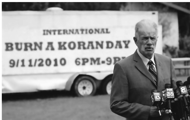
Obr. č. 18: Pastor Terry Jones s reklamou na kampaň vyzývající k pálení Koránu, Florida. Zdroj: Terry Jones, Quran Burnig & the Ground Zero Mosque . In: Strange Culture [online] 9. 9. 2010. [vid. 2013-11-10]. Dostupné z: http://www.strangecultureblog.com/2010/09/terry-jones-quran-burnig-ground-zero.html

Pragmatismus amerického náboženství se ale neprojevuje jen tímto poněkud kontroverzním způsobem. Za jeho součást či výraz je třeba považovat i takové skutečnosti jako pečlivá volba klíčových témat činnosti (praktické i ideové) konkrétních skupin. V tomto ohledu je tak například zmíněná The Jewis Climate Change Campaign stejně tak projevem náboženského aktivismu , jako výrazem pragmatismu „amerického náboženství“ . Podobných příkladů z dalších oblastí, jako jsou třeba ochrana lidských práv, sociální rovnost či naopak zdůrazňování „tradičních hodnot“ typu individualismu, bychom mohli jmenovat celou řadu.