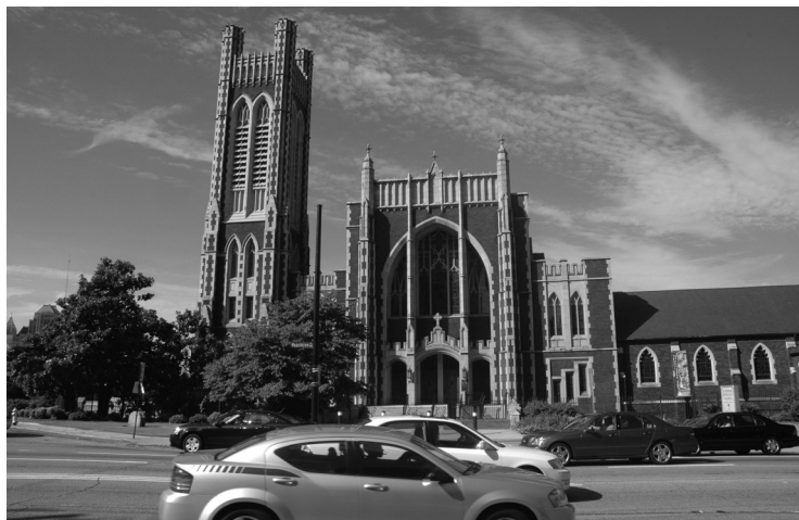
Obr. č. 8: Kostel pro nezařazené (unaffiliated) křesťany, Atlanta (GA).