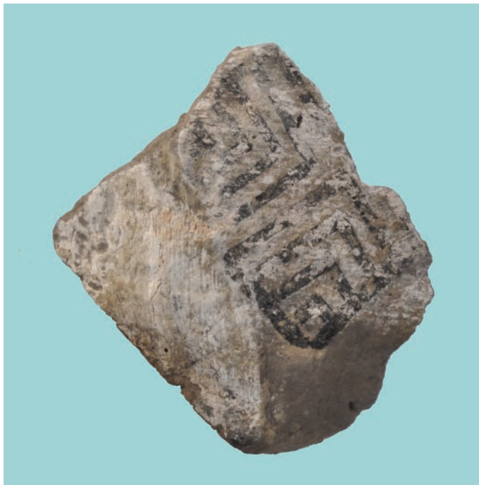
Obr. 2. Janíky - Dolné Janíky, mohyla IV. Súčasný stav zachovania negatívneho odtlačku maľby steny hrovej komory. Šírka artefaktu je 17,9 cm.

miestna časť Dolné Janíky (okres Dunajská Streda). Negatív sa podarilo vypreparovať z jej juhovýchodného nárožia, a to z výšky cca 40 cm nad podlahou. Stopy bieleho vápenného náteru sa vyskytovali aj v ďalších častiach priestoru komory, obzvlášť medzi okrajmi jednotlivých polkmeňov, ktoré boli vyplnené hlinitým materiálom a vyhladené. Výnimočne sa na niektorých miestach medzi druhým a tretím polkmeňom objavovali nepatrné zvyšky čiernej farby. Z charakteru zásypových vrstiev v jednotlivých častiach vnútorného priestoru komory vyplýva, že zrútením časti horizontálneho dreveného stropu, asi v dôsledku aktívít pri budovaní pravouhlej drevenej nadstavby pre uloženie následného pohrebu (Studeníková 2011, 242), bol zasiahnutý severný okraj jej strednej časti. Práve na tomto mieste došlo k takmer úplnej deformácii veľmi slabo vypálených častí tzv. kalenderberskej trojice, predovšetkým mesiacovitého idolu. Naopak pozdĺž obvodových stien a v nárožiach, ktoré boli spevňované z vonkajšej strany rôzne opracovávanými drevenými brvnami, preboril sa strop pravdepodobne oveľa neskôr. Miestami vznikli v komore preto aj celkom duté priestory. Vďaka nim sa zachovala nielen ucelenejšia sekundárna výzdoba keramiky, ale dali sa tiež pozorovať a čiastočne aj zdokumentovať zvyšky niektorých organických materiálov (košík, spráchnivené zvyšky šnúr, tkanín a kože).