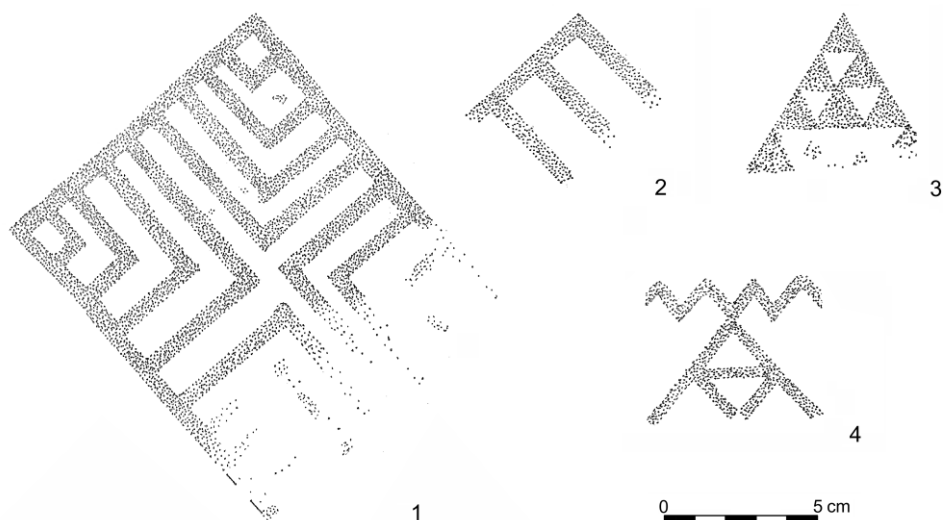
Obr. 3. Janíky - Dolné Janíky, mohyla IV. 1 – kresba pôvodnej podoby negatívu maľby hrobovej komory; 2–4 – výber z motívov sekundárnej čiernej maľby na hrobovej keramike.