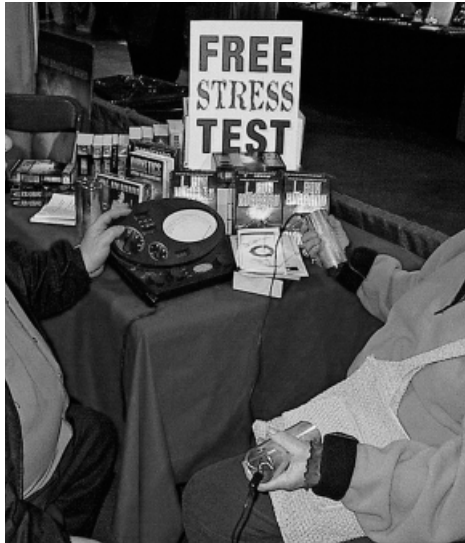
Obr. 1: E-metr.