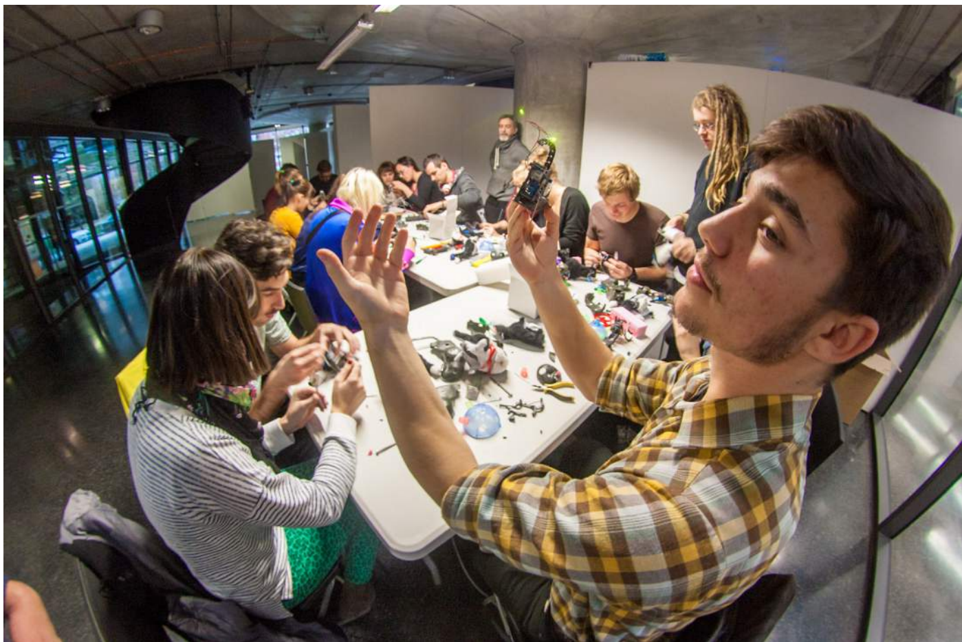
Obr. 6. Electronic Puppet Workshop se Zavenem Paré probudil v každém kreativního ducha.