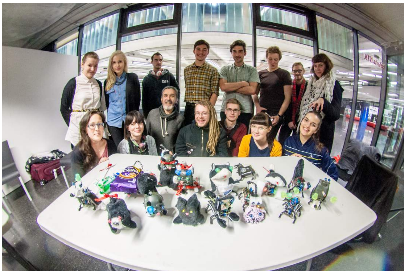
Obr. 8. Hrdí účastníci jednoho z workshopů se svými výtvy.