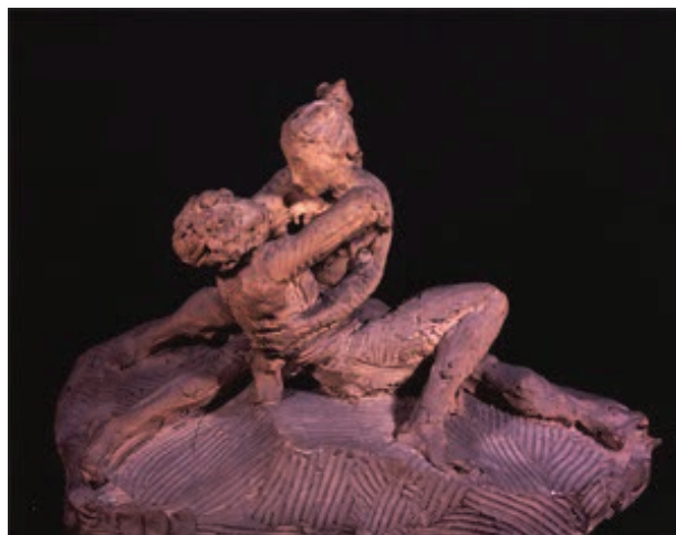
3 – Antonio Canova, Souboj – skica sousoší Psyché probouzené Amorovým polibkem. Possagno, Gipsoteca canoviana

Další fází uměleckého procesu bylo přenesení kresebného návrhu do trojrozměrné formy. Vznikla tak sochařská skica, tzv. bozzetto, v Canovově případě nejčastěji z vosky nebo hlíny. Tyto materiály jsou pro tento účel mimořádně vhodné, protože jsou levné a lehce přebírají nové formy. Winckelmann v této souvislosti tvrdí, že práce v hlíně znamená pro sochaře totéž, co kresba pro malíře. 11 Canovova bozzetta jsou na rozdíl od výsledných, detailně provedených a hladce povrchově upravených soch značně expresivní. Důvodem byla energie a rychlost, se kterou autor vnášel do studie svou invenci. Ke kompozici Amora a Psyché se dochovala celkem dvě bozzetta. Obě jsou si nápadně podobná. Postavy jsou natočeny hrudí k sobě, není zde však na první pohled zřejmé, která z postav je právě probouzena a zachráněna. Jejich těla shodně spočívají na pomyslné skále. [obr. 3, 4]