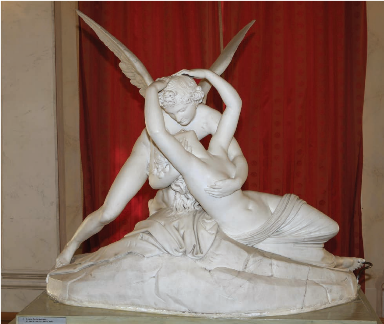
8 – Adamo Tadolini, Amor a Psyché , 1822. Kynžvart, zámek

dá motýlí křídélka, která jsou nápadným prvkem na sádrovém modelu. Naopak sádrovému Amorovi schází toulec se šípy, u mramorové kopie se tento atribut nalézá, spočívá však Amorovi za pravým ramenem, nikoli za levým, jako u originálu v Louvru. Přes všechny tyto rozdíly mají sochy nezpochybnitelné společné rysy, značí jasnou souvislost mezi modelem a mramorovým sousoším; těmito znaky jsou Amorovy odhalené genitálie, horizontální a méně dynamická podoba jeho křídel a zakrytí celých nohou Psyché. Nejvýraznější spojitostí se bezpochyby stává soulad skály a draperie, která na ní spočívá. Útvar, jenž je vytvořen těmito dvěma prvky, nápadně připomíná tvar mušle a u obou soch je zcela shodný. [obr. 7]