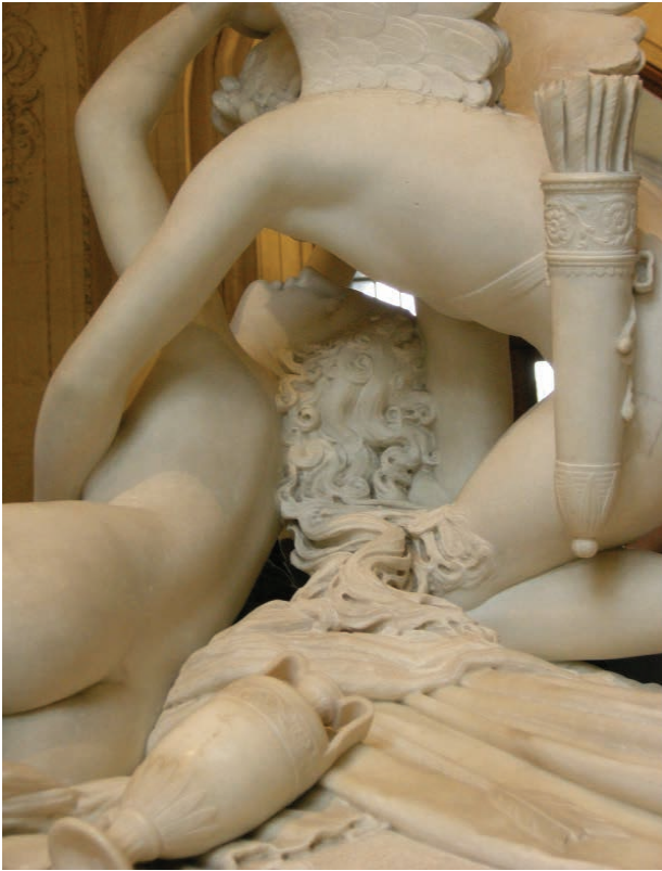
10 – Antonio Canova, Psyché je probouzena Amorovým polibkem – detail. Paříž, Musée du Louvre