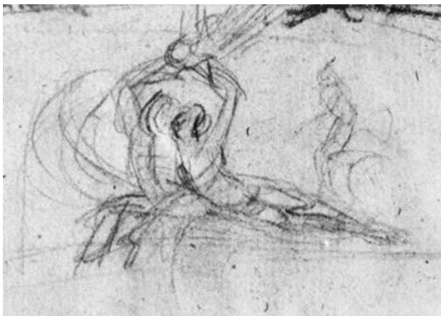
2 – Antonio Canova, Souboj – skica sousoší Psyché probouzené Amorovým polibkem. Benátky, Museo Correr

dvojici Fauna a bakchantky . Canovu zřejmě uspořádání postav značně zaujalo, protože jej promítl do řady přípravných prací k dílům, jakými byly např.: Venuše oplakává Adonise , Dvě vzájemně propletená těla Hyláse a nymfy (?) a nepochybně i do několika skic a modelů Amora a Psyché . 9 Z původní starověké malby přejal motiv ležící, spoře oděné ženy, nad kterou se sklání mužská postava. Tuto nápadnou analogii umocňuje shodná pozice paží Fauna i Amora, kteří jednou rukou podpírají hlavu ležící dívky a druhou nechávají spočinout na jejím poprsí.