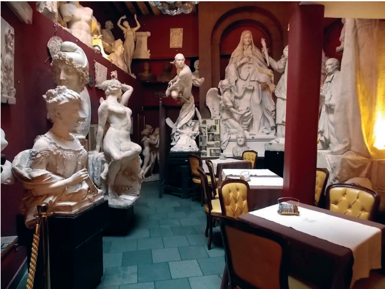
11 – Sochařský atelier Antonia Canovy a Adama Tadoliniho. Řím, Museo Atelier Canova Tadolini

připodobňovalo k největším historickým osobnostem; přecházející Alpy jako Hannibal, vítězící v Egyptě jako Caesar a tvůrce císařství jako Karel Veliký. Během dvaceti let se Napoleon, který nebyl ani pohledný, ani sportovec, stal díky umělcům největším neoklasicistním hrdinou. Canova přispěl k tomuto obrazu císaře mramorovou sochou, kde vylíčil Napoleona jako řeckého boha, tak jak Římané zobrazovali císaře Augusta, jako božského, mladého, v dokonalé nahotě. Canova tuto sochu charakteristicky nazval Napoleon jako Mars mírotvůrce . Za sochařskou nahotou však nemusela být vždy spatřována umělecká myšlenka, hranice mezi uměním a obsceností či karikaturou nebyla vždy přesně vytyčena. To dobře věděl i Napoleon, když sám poznamenal: „ Du sublime au ridicule il n’y a qu’un pas “. 52 Přestože Canova použil „ideální nahoty“ v duchu tradice císařského portréru, když Napoleon sochu v Paříži roku 1811 spatřil, odmítl ji, označil ji za „ trop athletique “ a zakázal přístup veřejnosti. 53 Rozpaky z možných výkladů nahoty pociťoval zřejmě i Metternich při pohledu na sousoší Amora a Psyché : „ A já v těchto dnech, kdy mne navštěvují nevinní, budu musít přehodit přes Amora