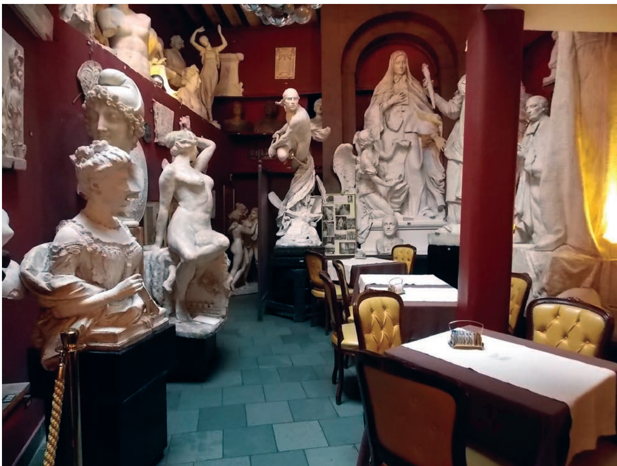
11 – Sochařský atelier Antonia Canovy a Adama Tadoliniho. Řím, Museo Atelier Canova Tadolini

připodobňovalo k největším historickým osobnostem; přecházející Alpy jako Hannibal, vítězící v Egyptě jako Caesar a tvůrce císařství jako Karel Veliký. Během dvaceti let se Napoleon, který nebyl ani pohledný, ani sportovec, stal díky umělcům největším neoklasicistním hrdinou. Canova přispěl k tomuto obrazu císaře mramorovou sochou, kde vylíčil Napoleona jako řeckého boha, tak jak Římané zobrazovali císaře Augusta, jako božského, mladého, v dokonalé nahotě. Canova tuto sochu charakteristicky nazval Napoleon jako Mars mírotvůrce . Za sochařskou nahotou však nemusela být vždy spatřována umělecká myšlenka, hranice mezi uměním a obsceností či karikaturou nebyla vždy přesně vytyčena. To dobře věděl i Napoleon, když sám poznamenal: „ Du sublime au ridicule il n’y a qu’un pas “. 52 Přestože Canova použil „ideální nahoty“ v duchu tradice císařského portrétu, když Napoleon sochu v Paříži roku 1811 spatřil, odmítl ji, označil ji za „ trop athletique “ a zakázal přístup veřejnosti. 53 Rozpaky z možných výkladů nahoty pociťoval zřejmě i Metternich při pohledu na sousoší Amora a Psyché : „ A já v těchto dnech, kdy mne navštěvují nevinní, budu musít přehodit přes Amora