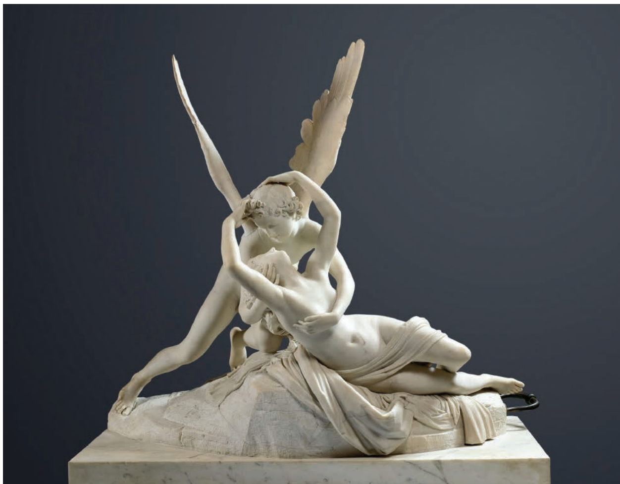
1 – Antonio Canova, Psyché probouzená Amorovým polibkem , 1793. Paříž, Musée du Louvre

Mnoho zachovalých návrhů, skic a modelů sousoší je pro nás důkazem pečlivých Canovových příprav před vlastním vytvořením díla. Dochované studie mají velice podobnou kompozici a zdá se tedy, že Canova měl od počátku jasnou představu o vizuálním řešení postav. Inspirací se mu pravděpodobně stal spis Le Pitture Antiche D'Ercolano (1757–1771), který obsahoval rytiny podle maleb nalezených ve znovuobjeveném antickém městě Herculaneu, 7 jenž Canova rovněž navštívil v době svého pobytu v Neapoli v roce 1787. 8 Konkrétní rytina od Raffaella Morghena (1758–1833), kterou Canova okopíroval v jedné ze svých skic, zachycovala