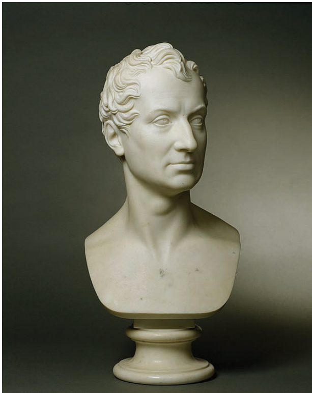
12 – Bertel Thorvaldsen, Kníže Klement Václav Lothar Metternich , 1819. Kodaň, Thorvaldsens Museum

ném a neposkrvněném vyobrazení. Hladká těla připomínají fajánsové sošky, dívčino vyvinuté poprsí odhaluje nevinné dospívající tělo v očekávání tajemného příchodu sexuality. 58