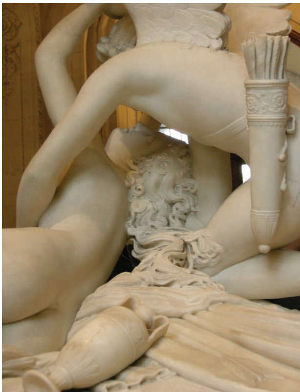
10 – Antonio Canova, Psyché je probouzena Amorovým polibkem – detail. Paříž, Musée du Louvre