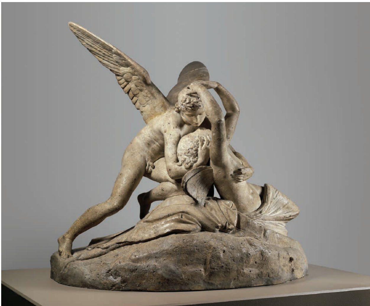
5 – Antonio Canova, Psyché je probouzena Amorovým polibkem , 1794. New York, Metropolitan Museum of Art

Socha se rychle stala středem zájmu několika majetných sběratelů, kteří sochaře žádali o repliky. Umělecké