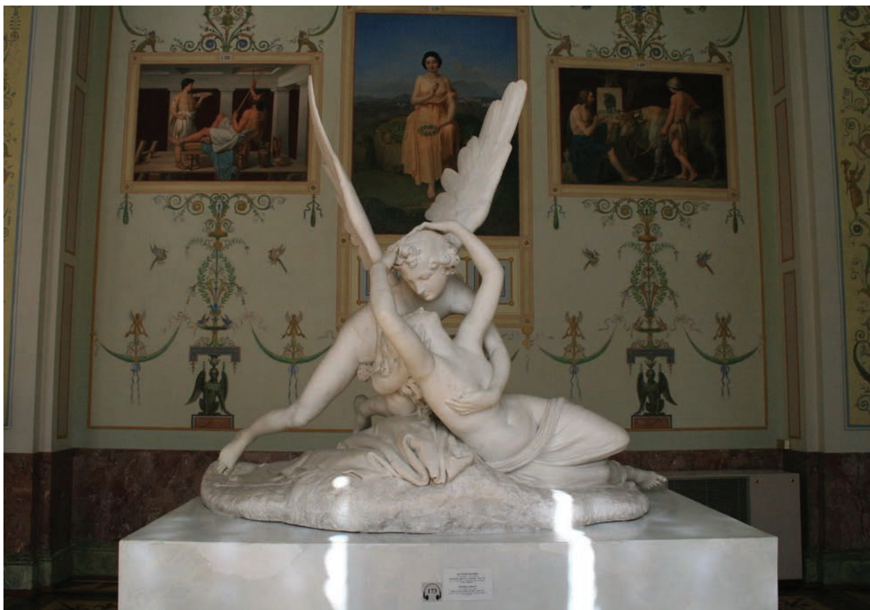
6 – Antonio Canova, Amor a Psyché , 1796. Petrohrad, Ermitáž

publikace však do rejstříku Canovových uměleckých děl řadí pouze jedinou repliku, a to sousoší Amora a Psyché vytvořenou na objednávku ruského knížete Nikolaje Jusupova (1726–1831) v roce 1796, která je dnes vystavena v petrohradském muzeu Ermitáž. 16 Kníže Jusupov byl příkladem objednavatele, který po umělci vyžadoval určité úpravy, konkrétně vyzval sochaře k vytvoření poněkud cudnější Psyché, které mušelin zakrýval celé nohy, a Amorovy genitálie byly zakryty listem. Zřejmě tyto nároky byly důvodem, proč Ca-