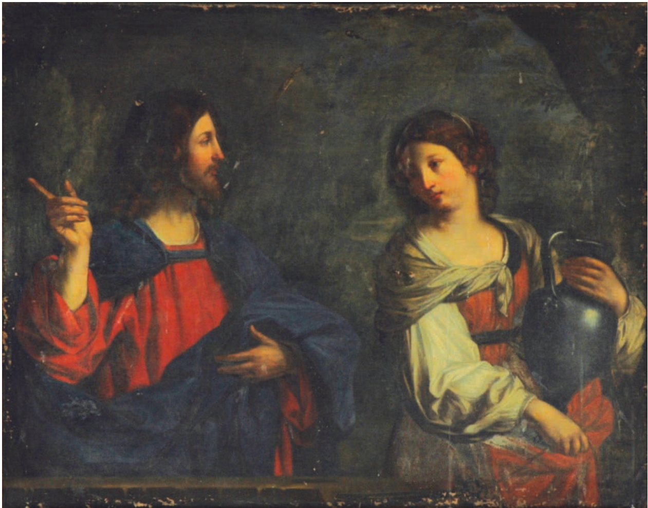
15 – Giovanni Francesco Barbieri, zv. Guercino – kopie, Kristus a Samaritanka u studny . Státní zámek Rájec nad Svitavou

rájeckých obrazů objevují strojem psané papírové štítky, které mají bezprostřední souvislost s inventářem vzniklým těsně před koncem 2. světové války. Ty kromě stručného popisu obrazu, případného návrhu jeho autorského určení a datace, údaje o signatuře a nápisech informují rovněž o jejich restaurování, které na počátku dvacátých let provedl vídeňský malíř a restaurátor Josef Balla (1866–1948). 51 Obzvláště důležitý informační zdroj představují ojediněle se vyskytující nápisy, eventuálně sběratelské značky, které nás přivádějí na stopu předchozího držitele obrazu. Tak je tomu zejména v případě barokní znakové pečeti Dietrichsteinů, [obr. 9] otištěné na dřevěné podložce několika výtvarně mimořádně kvalitních ukázek tvorby německých a nizozemských malířů 16. a 17. století. 52 Ty zřejmě pocházejí z kolekce obrazů vyhlášeného milovníka umění a mecenáše umělců, Leopolda hraběte z Dietrichsteinu (1703–1773), 53 z té její části, která byla soustředěna v jeho brněnském paláci na dnešní Masarykově třídě. Do majetku Salmů přešly nejspíše v roce 1784, poté co palác „samt Zuge-