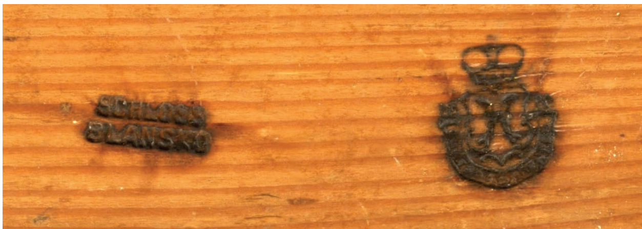
12 – Vypálená vlastnická značka Salm-Reifferscheidtů na obrazech použitých k výzdobě zámku v Blansku, 2. polovina 19. století

Kromě dosud zmíněných inventářů se zejména ve fondech rodinného archivu Salmů a jejich velkostatku uchovaly i další, dílčí seznamy, respektive poznámky a výpisky ze slovníkové literatury k biografickým zastoupených umělců, dosvědčující nepokrytý zájem Salmů o odborné zpracování jejich sbírky obrazů. 42 Další cenná zjištění se o obrazech salmovské sbírky, stejně o péči, kterou jim jejich majitelé věnovali, případně i o vřelých kontaktech s žijícími umělci se podařilo vytěžit také z rozsáhlé korespondence, kterou vedl Hugo I. František starohrabě ze Salm-Reifferscheidtu se svými dvěma syny, respektive s Josefem von Hormayrem či dalšími přáteli, mj. s lipským podnikatelem a sběratelem Maximilianem Speckem von Sternburg (1776–