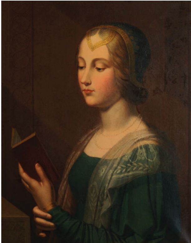
17 – Hans Veit Schnorr von Carolsfeld, Laura , 1822. Státní zámek Rájec nad Svitavou