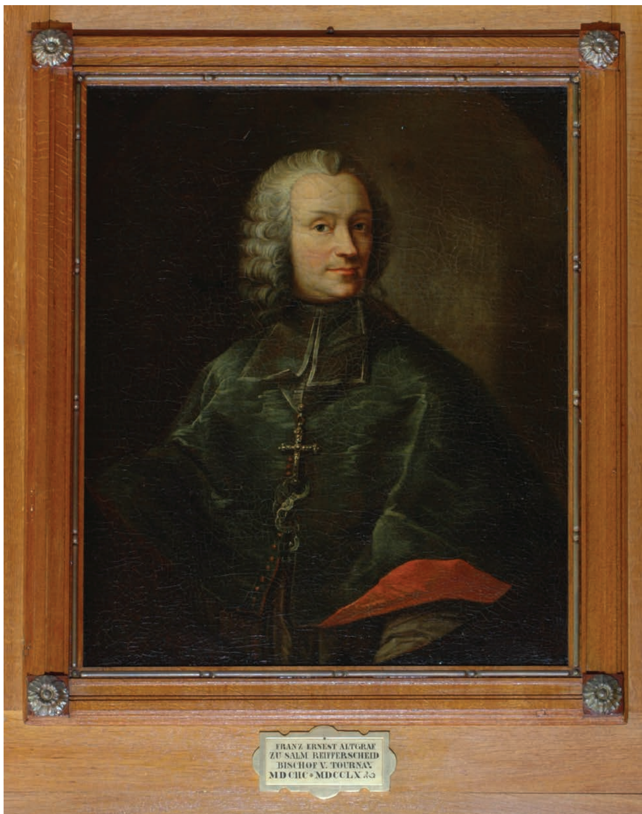
2 – Biskup Franz Ernst starohrabě ze Salm-Reifferscheidtu (1698–1770), po 1731. Státní zámek Rájec nad Svitavou