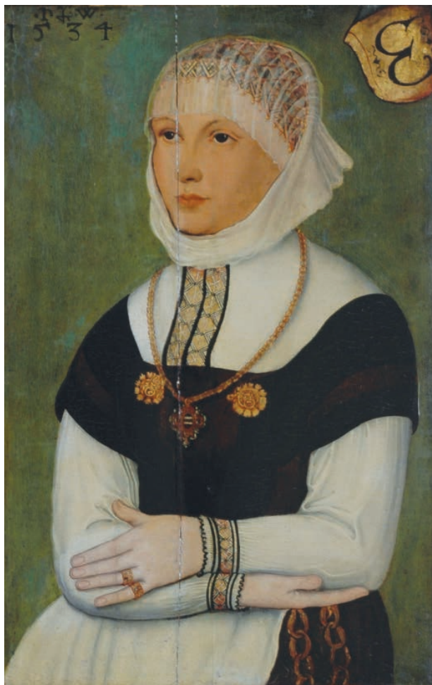
7 – Saský monogramista z roku 1534, Podobizna ženy se zlatým řetězem , 1534. Státní zámek Rájec nad Svitavou

zjevně vyhrazena obrazovému kabinetu. V jeho dřevěném táflování našlo umístění celkem 19 obrazů („19 – In den von Aichen Holtz von Boasorie Wände in Oel Farben gemahlene Bilder“), zatímco 120 zarámovaných francouzských rytin („120 französische Kupfer Stichbilder hintern Glass in Aichen Rahmen mit vergolten Stabel Leisteln“) se nacházelo v dalším z pokojů. Obrazy, zejména portréty, ale i grafické listy, mapy („illuminirte Perspektiv Bilder und Städte“), plány a kresby se před rokem 1800 sice v hojně míře podílely na výzdobě reprezentačních i obytných místností zámku, ale vyjma celkového počtu obrazů žádný z těchto seznamů neskýtá potřebnou oporu pro precizování tematické a autorské skladby tehdejšího salmovského obrazového majetku. Po smrti knížete Karla Josefa byl největší počet obrazů koncentrován v pianu nobile zámku; kupříkladu v zeleném pokoji bylo instalováno celkem 71 „grosse, mittlere und kleine gemahlene Bilder“, v rohovém kabinetu 65 a biliardovém pokoji 14 velkých obrazů, zatímco v obrazovém kabinetu ( Bilderzimmer ) 118 zarámovaných rytin. A tak kromě uvedené Rincoliniho