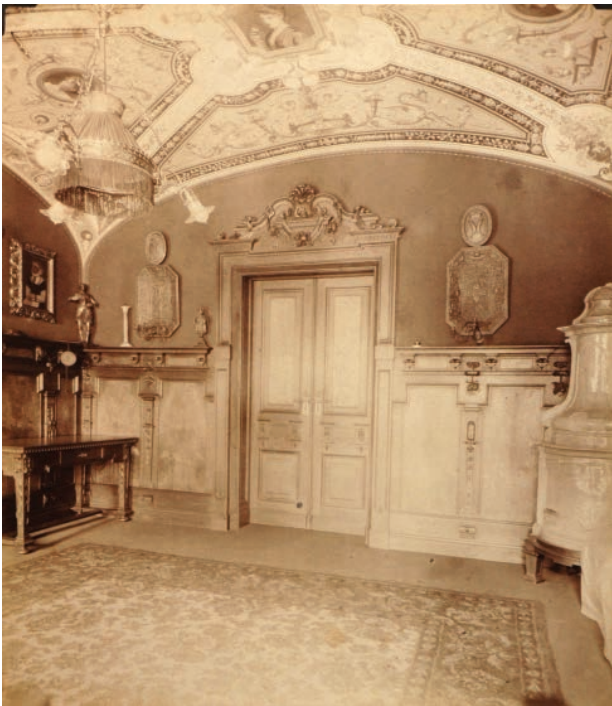
6 – Interiér Salmovského paláce ve Vídni (?) s podobiznou ženy od saského monogramisty z roku 1534. Státní zámek Rájec nad Svitavou

velmi kvalitní repliky slavné kompozice Smrt sv. Cecilie pro sbírku jeho bratra, případně synovce Huga I. Františka, nelze prozatím doložit. 28 [obr. 5] Na bezprostřední spojitost s rájickou obrazárnou ovšem nepokrytě ukazují některé z třinácti portrétů biskupových příbuzných, které včetně biskupova kolem 1790 pro tzv. salmovský pokoj biskupské rezidence v Klagenfurtu namaloval vídeňský portrétista Georg Weickert (1745–1799). Předlohy pro ně totiž nabídl rodinná portrétní galerii instalovaná na zámku v Rájci nad Svitavou, pro níž ostatně Weickert vytvořil několik portrétů. 29