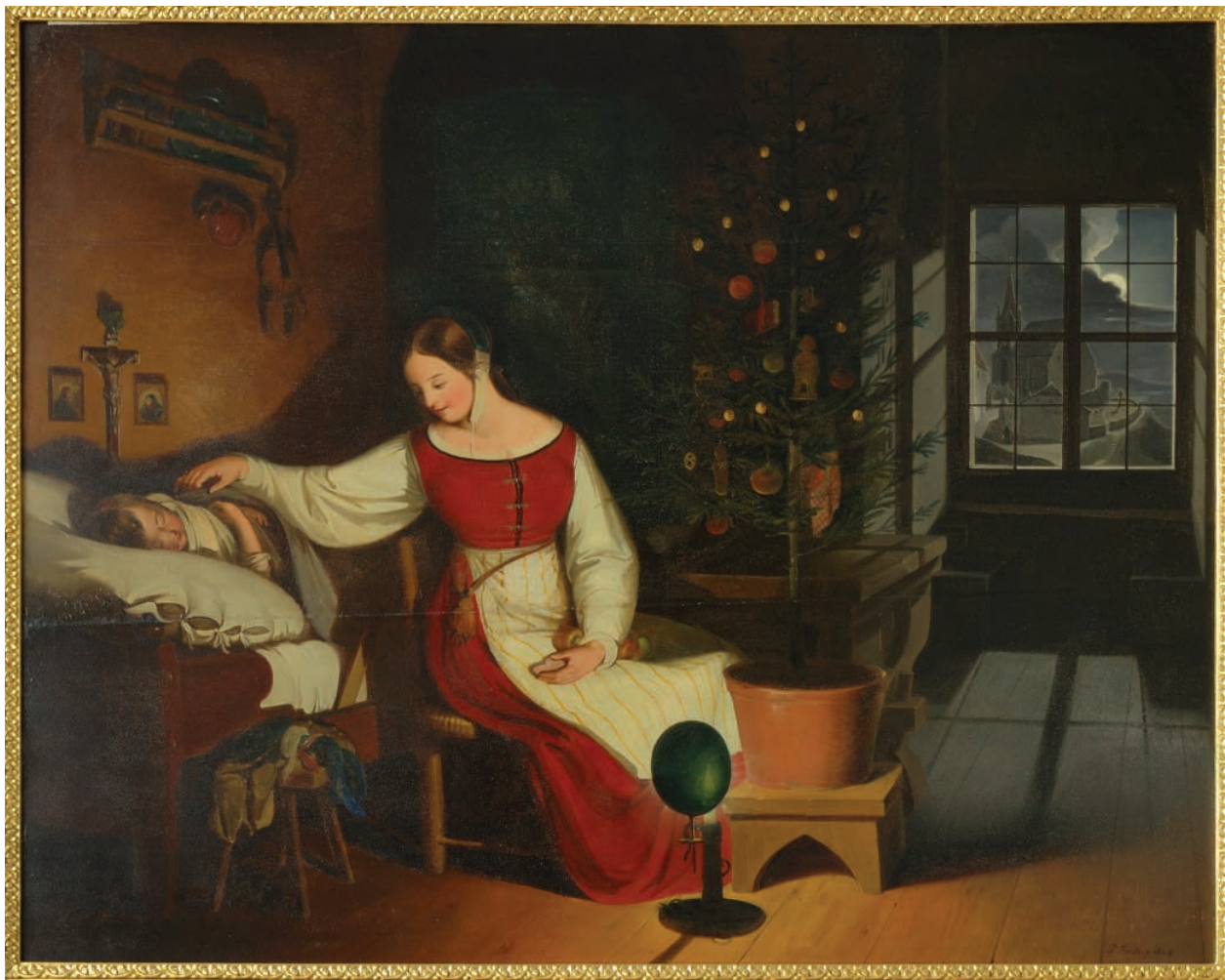
19 – Peter Fendi, Matka se spícím dítětem u vánočního stromku , 1824. Státní zámek Rájec nad Svitavou

1. der Kopf eines Mannes grell beleuchtet über die Thüre die in das zweite Zimmer führt.