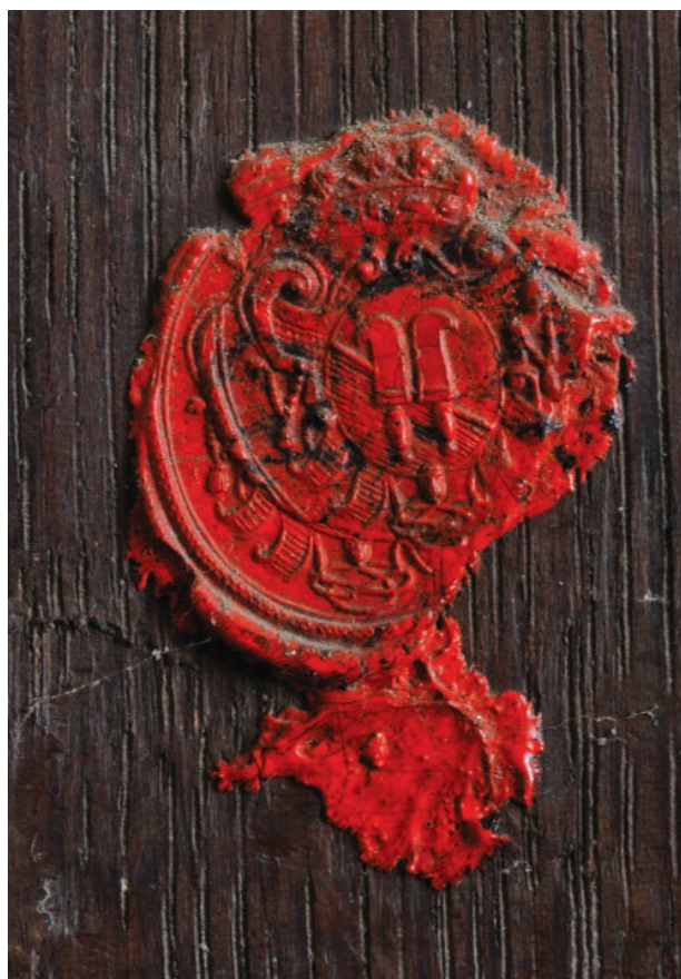
9 – Znaková pečeť Dietrichsteinů na rubu obrazů salmovské obrazárny