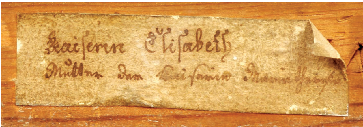
11 – Štítek s identifikačním nápisem na rubu obrazu salmovské obrazárny, inv. č. RA 1447

Rembrandtova okruhu (306 Rembrandtschule, Ölgemälde „Ein alter Mann am Gewand Goldstickerei“ ... 120 K ), respektive trojice holandských krajinomaleb (190 Ölgemälde in der Art des Saft Leven „2 Mondlandschaften“ ... 70 K ; 265 J. Both? Ölgemälde „Landschaft am Abend, an den Seiten hohe Laubbaum, goldige Himmel, vorne eine Hirtengruppe ... 190 K ).