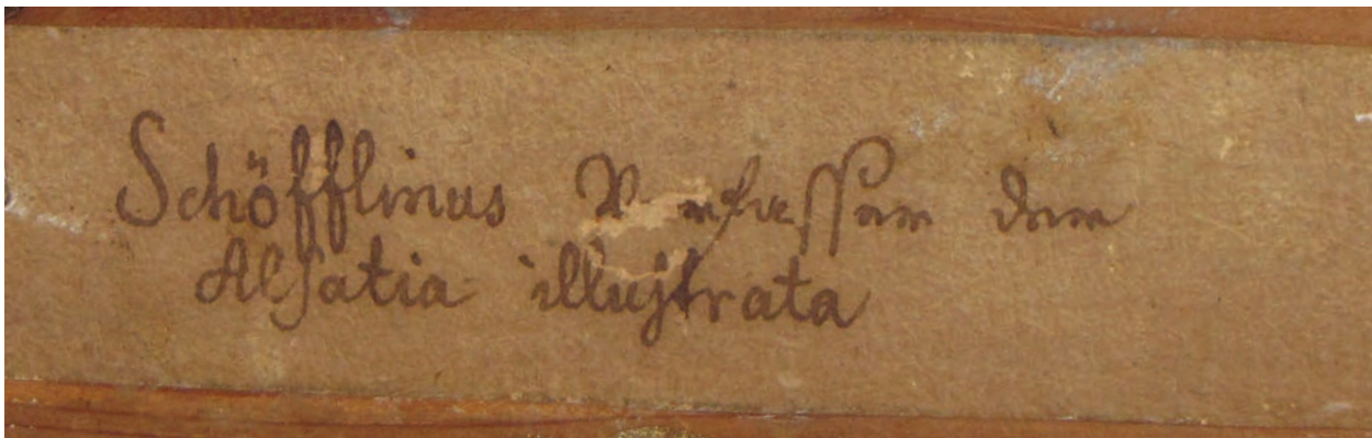
10 – Štítek s nápisem „Schöfflinus Verfasser der / Alsatia illustrata“ na rubu obrazu salmovské obrazárny, inv. č. RA 1444

torskému určení. Na sestavení těchto odhadů se po smrti knížete Hugo III. Karla Františka (9. 11. 1832 Praha – 12. 5. 1890 Vídeň) a jeho syna Hugo IV. Leopolda (2. 12. 1863 Vídeň – 31. 12. 1903 Vídeň) totiž podíleli respektovaní znalci umění; v roce 1890 vyhlášený vídeňský obchodník Carl Josef Wawra (1839–1905) 33 a 1904 brněnský malíř a také též sběratel Emil Pirchan st. (1844–1928). 34 Další známé inventury, spojené částečně i s finančním oceněním obrazů, se uskutečnily v roce 1937, popřípadě na samém sklonku druhé světové války v roce 1944. První provedl brněnský podnikatel a sběratel Otakar Vaňura (1893–1962), 35 když o získání tohoto úkolu spolu s ředitelem opavského muzea Edmundem Wilhelmem Braunem (1870–1957) všemožně usiloval jiný brněnský znalec Maximilian Steif (1881–1942), 36 a druhou pak na doporučení Karla Marii Swobody studentky dějin umění Německé univerzity v Praze Christiane Engelbrecht a Maria von Thadden (*1922). 37 Konečně stav mobiliáře bezprostředně po konfiskaci zámku zachycuje soupis z února 1946. 38