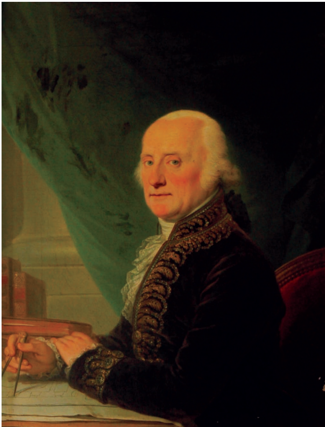
16 – Johann Baptist Lampi st., Karel Josef kníže ze Salm-Reifferscheidtu (1750–1838), po 1800. Státní zámek Rájec nad Svitavou