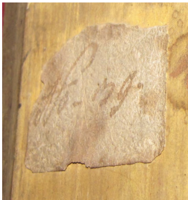
8 – Barokní inventární číslo neznámé (salmovské?) sbírky na rubu obrazu salmovské obrazárny, inv. č. RA 1436

Pozdější inventáře, které máme k dispozici z přelomu 19. a 20. století, obsahují již mnohem více relevantních sdělení, a to nejen k rozmístění jednotlivých uměleckých děl v prostorách zámku, ale i k jejich ikonografickému i au-