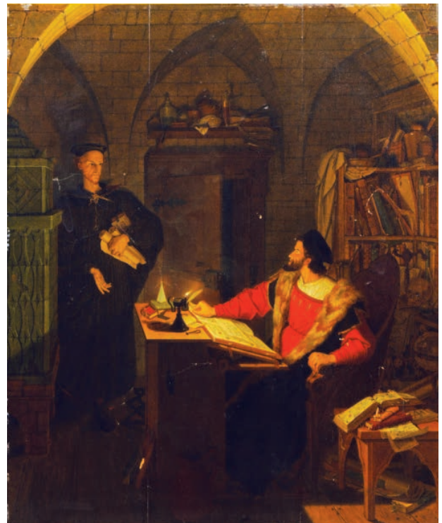
18 – Ludwig Ferdinand Schnorr von Carolsfeld, Faust , 1819. Státní zámek Jaroměřice nad Rokytnou, svoz Budkov

na univerzitě ve Štrasburku. 57 Naznačuje to papírový štítek s perem psaným záznamem: Schöpflinus Verfassers der / Alsatia illustrata , [obr. 10] zachovaný na zadní straně napínacího rámu jednoho ze série portrétů krásných žen, které vznikly v dílně slavného Petra Lelyho. Stejnou rukou je napsána i poznámka na dalším portrétu, který portrétovanou chybně ztotožňuje s císařovnou Alžbětou Kristýnou Brunšvicko-Wolfenbüttelskou, matkou Marie Terezie. 58 [obr. 11] Předpokládáný majitel těchto portrétů, autor dvojdílného historicko-topografického spisu Alsatia illustrata (Colmar 1751 a 1761) a jeden z čelných představitelů evropského osvícenství, pobýval ve třicátých a čtyřicátých letech ve Vídni a v roce 1739 mu zde na přímmluvu jeho krajana, vlivného Johanna Christophu von Bartenstein (1689–1767) bylo nabídnuto prestižní místo prefekta dvorní knihovny. V roce 1747 se stal vychovatelem mladého Josefa II. a je tudíž nanejvýš pravděpodobné, že tehdy mohlo dojít i k jeho seznámení s Antonínem Josefem Karlem starohrabětem ze Salm-Reifferscheidtu. Když později, před rokem 1769 jeho dva synové Karel Josef a Franz Xaver absolvovali kavalírskou cestu, podílel se Johann Daniel Schöpflin za jejich pobytu ve Štrasburku, který předčasně ukončil náhlý skon jejich otce, na jejich výchově. 59 Nabízí se proto lákavá a nanejvýš pravděpodobná hypotéza, že oba