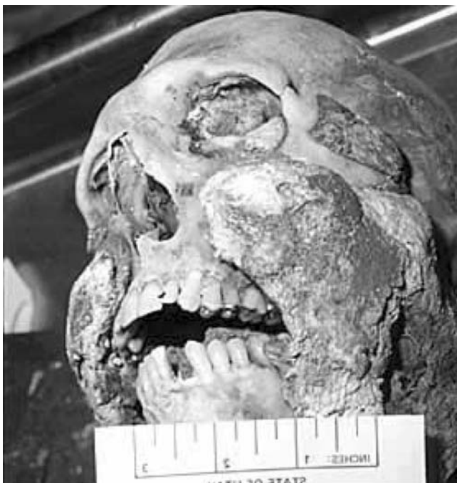
Obr. 2. Adipocire na obličejových partiích lebky.