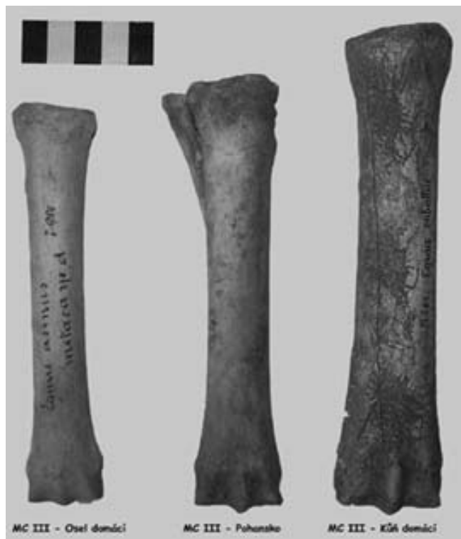
Obr. 1. Porovnání os metacarpale III osla, koně a nálezu z Pohanska. Abb. 1.: Vergleich des dritten Mittelfußknochens (Os metacarpalis III) bei Esel, Pferd und dem Fund aus Pohansko.

Téma příspěvku předneseného na konferenci „Archeologie doby hradištní“ vyplynulo z posledních zjištění archeozoologických analýz prováděných na početně bohatém osteologickém materiálu z velkomoravského hradiska Pohansko u Břeclavi. Cílem osteologického zkoumání je snaha postihnout možné ekonomické i sociální rozdíly jednotlivých sídelních struktur této raně středověké pevnosti. Při hodnocení zvířecích nálezů, které pocházely z výzkumu označeném jako Lesní hrád, se v souboru