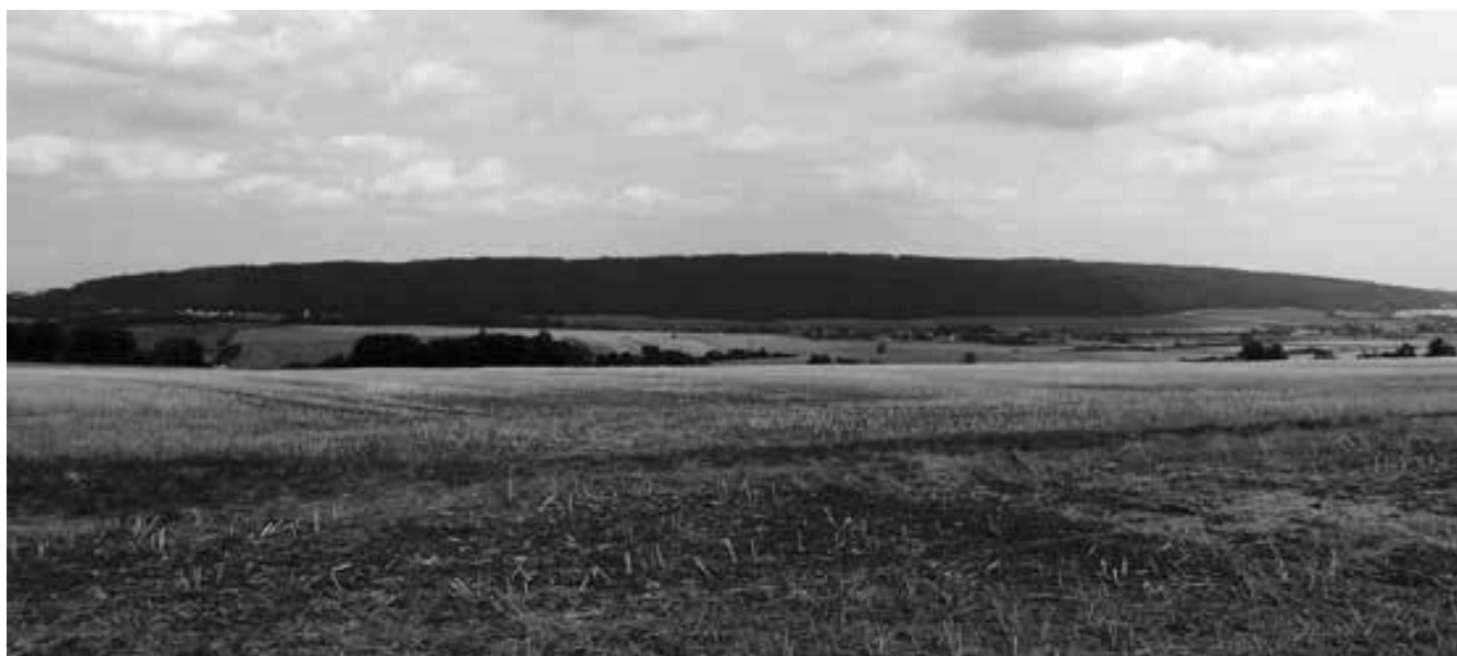
Obr. 2: Pohled z lokality Kostelec na Hané I – Niva severním směrem k masivu Velkého Kosíře, který leží v jižní části Zábřežské vrchoviny.

V severní části sousedí s Dražanskou vrchovinou geomorfologický celek Hornomoravský úval (1 315 km 2 , průměrná nadmořská výška 225,8 m), konkrétně jeho západně situovaný podcelek Prostějovská pahorkatina. Hornomoravský úval je výrazná sníženina protažená ve směru severozápad–jihovýchod. Osu úvalu tvoří niva řeky Moravy. Na severu a východě hraničí Prostějovská vrchovina s geomorfologickým podcelkem Středomoravská niva. Přejít do sníženiny Vyškovské brány na jihozápadě je plynulý. Hornomoravský úval je vyplněný neogenními a kvarténními sedimenty, mezi nimiž jako malé ostrůvky vystupují horniny Českého masivu. Území úvalu západně od Moravy se dělí na tři části vymezené nivami Hané, Valové (Romže a Hloučely) a Blaty. Území