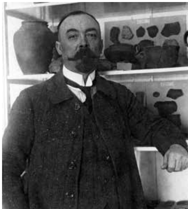
Obr. 8: Inocenc Ladislav Červinka, jeden z nejvýznamnějších moravských archeologů, provedl jako první archeologický výzkum na lokalitě Ondratice I/Želeč. Fotografie z konce 20. let 20. století.