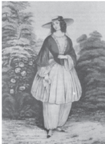
Dama con bombachos en 1850

La pionera del feminismo, la americana Amelia J. Bloomer, proporcionó su apellido al nombre en inglés de la versión femenina de estos pantalones que se convirtieron en símbolo de sus reivindicaciones; la pasión por la bicicleta de finales del siglo XIX dio un impulso a esta prenda, mucho más cómoda para andar en bici y otros menesteres que la falda ahuecada con miriñaque 17 .