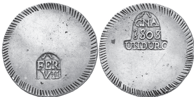
Duro de Gerona, 1808

El napoleón fue una moneda francesa de cinco francos, en circulación en España durante la guerra de la Independencia; tenía un valor de 19 reales y se registra ya en el diccionario de Domínguez del año 1853, pasando al diccionario académico en la edición del año 1869.