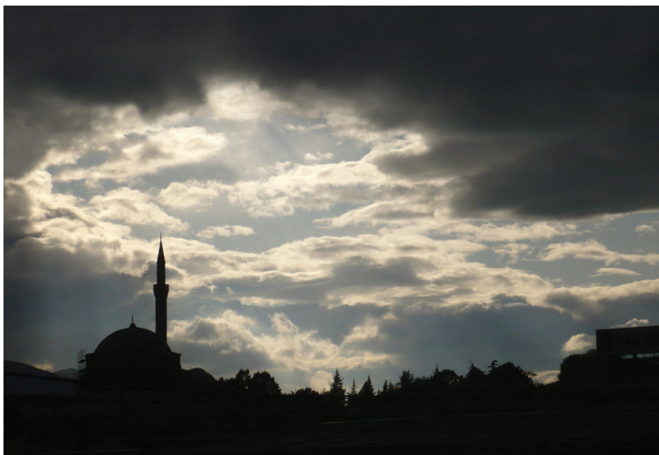
Obrysy v podvečerním slunci