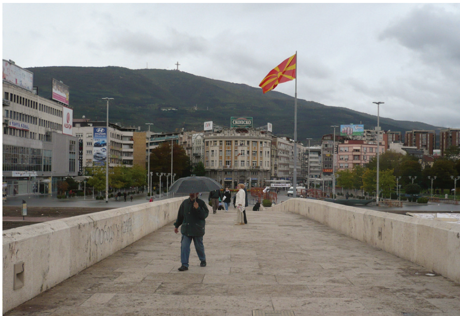
Po Kamenném mostě na Náměstí Makedonie