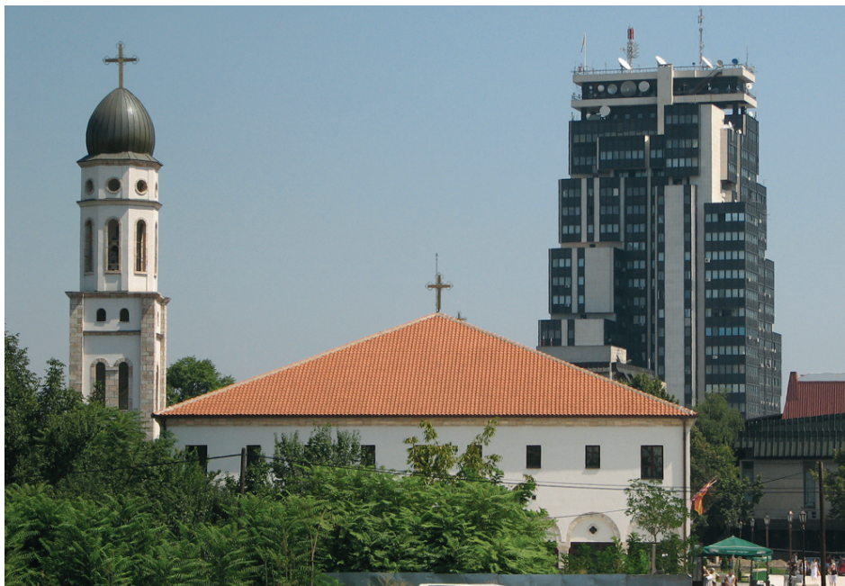
Chrám Nejsvětější Bohorodičky