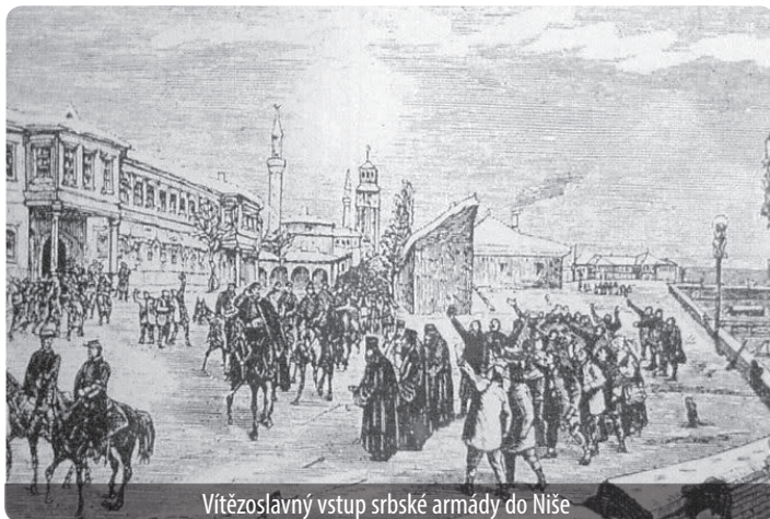
Vítězoslavný vstup srbské armády do Niše