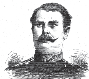
Plukovník Miloško Lešjanin

Osmanská armáda zaútočila na Srbské knížectví z oblasti Niše a i přes srbské odhodlání a pomoc ruských dobrovolníků pod velením generála Čerňajeva se první srbsko-turecká válka vyvíjela ve prospěch nepřítele. Turci pronikli hluboko na srbské území, ušetřili Srbům zdrcující porážku u Ćunisu a obsadili strategicky důležité město Aleksinac vzdálené necelých 20 km. Totální katastrofu odvrátil pouze hbitý zásah ruské diplomacie, která poslala Vysoké Portě ultimátum požadující okamžité zastavení bojů.