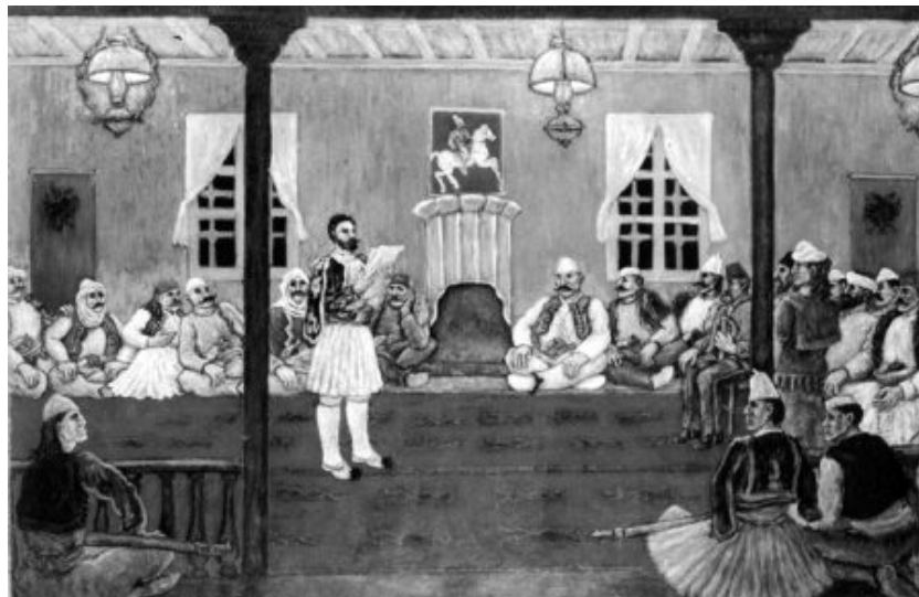
Doslova v poslední chvíli bylo na 10. června 1878 do Prizrenu svoláno celonárodní albánské shromáždění, které vstoupilo do historie jako Albánská nebo Prizrenská liga, aby před celou Evropou hájilo zájmy Albánců.