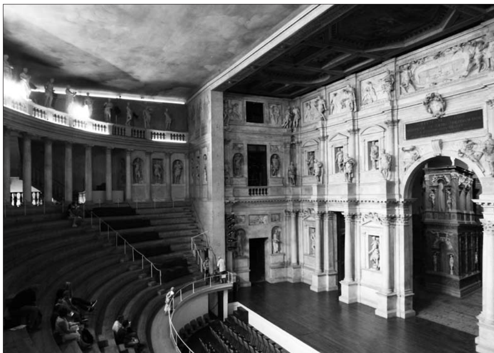
Obr. 2: Teatro Olimpico.

architektonických principů, z nichž je utkán ideální obraz návratu k antice, této utopie promítnuté do minulosti. G. V. Pinelli, současník, který se však premiéry nezúčastnil, napsal, že toto mohutně vypadající divadlo je vlastně „Il teatro troppo piccolo“, příliš malé divadlo (GALLO 1973: 59). Deklarovaná kapacita 5000 (nebo 3000?) diváků byla nejspíše silně nadsazená.