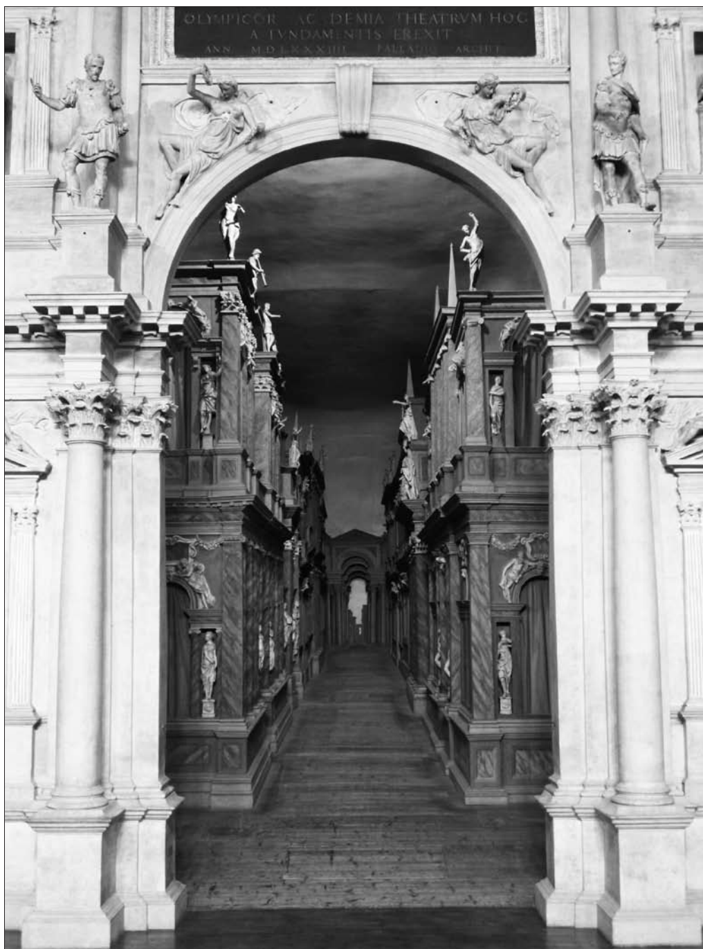
Obr. 1: Průhled do Scamozziho „thébské“ ulice.