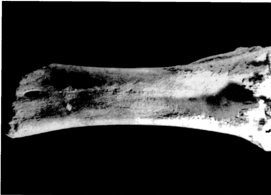
Obr. 2. prst ní kost skotu s exostosami.