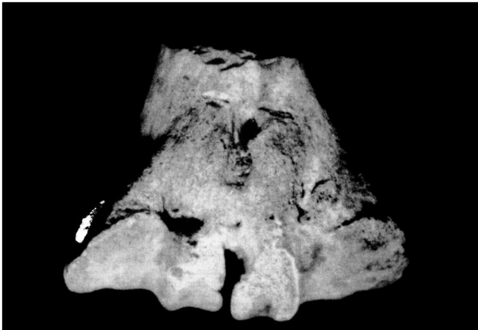
Obr. 4. Patologicky změněná kladka záprslní kosti skotu.