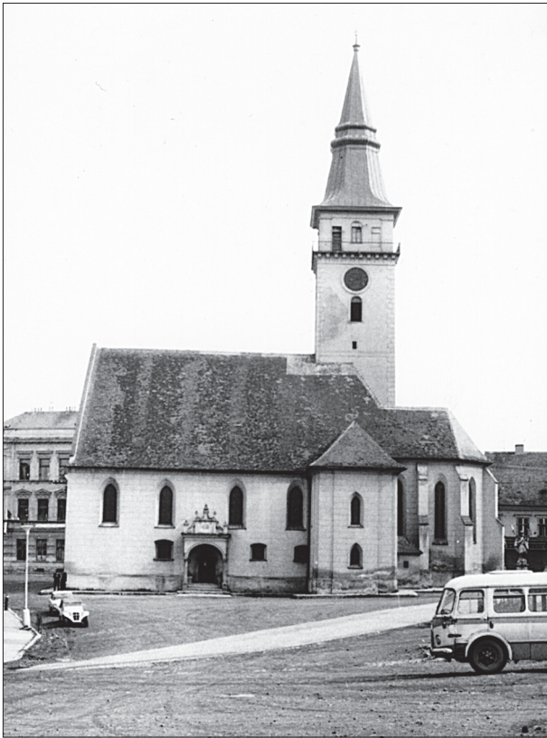
Obr. 7. Farní kostel sv. Stanislava od jihu v roce 1969.

ale přesto naplňují představu kastelu inspirovaného pravidelnými francouzskými hrady (Plaček 1996, 185; 1997, 201; Koběrská–Macek 1997, 99, 114). Krom toho nic nenasvědčuje románskému původu jemnických hradeb, pro jejichž stavbu okolo roku 1227 mimo onu listinu prostě není jiného dokladu. Vždyť i mnohem významnější Znojmo v roce 1226 vymezoval jen příkop a kamenné hradby se stavěly v průběhu velké části 13. století (Razím 2003, 21). V Brně, jehož zděné opevnění patří k nejstarším, vznikla hradba do poloviny 13. století (Procházka 2000, 122–124). Naproti tomu nálezy v jemnickém hradním parkánu vypovídají o existenci jemnické hlavní hradby, s parkánovou zdí hradu svázané, ve 14. století. O existenci hradby v roce 1327 nepřímo vypovídá velké privilegium krále Jana Lucemburského, v němž se hovoří o městských věžích (CDM VI, 254, č. 325).