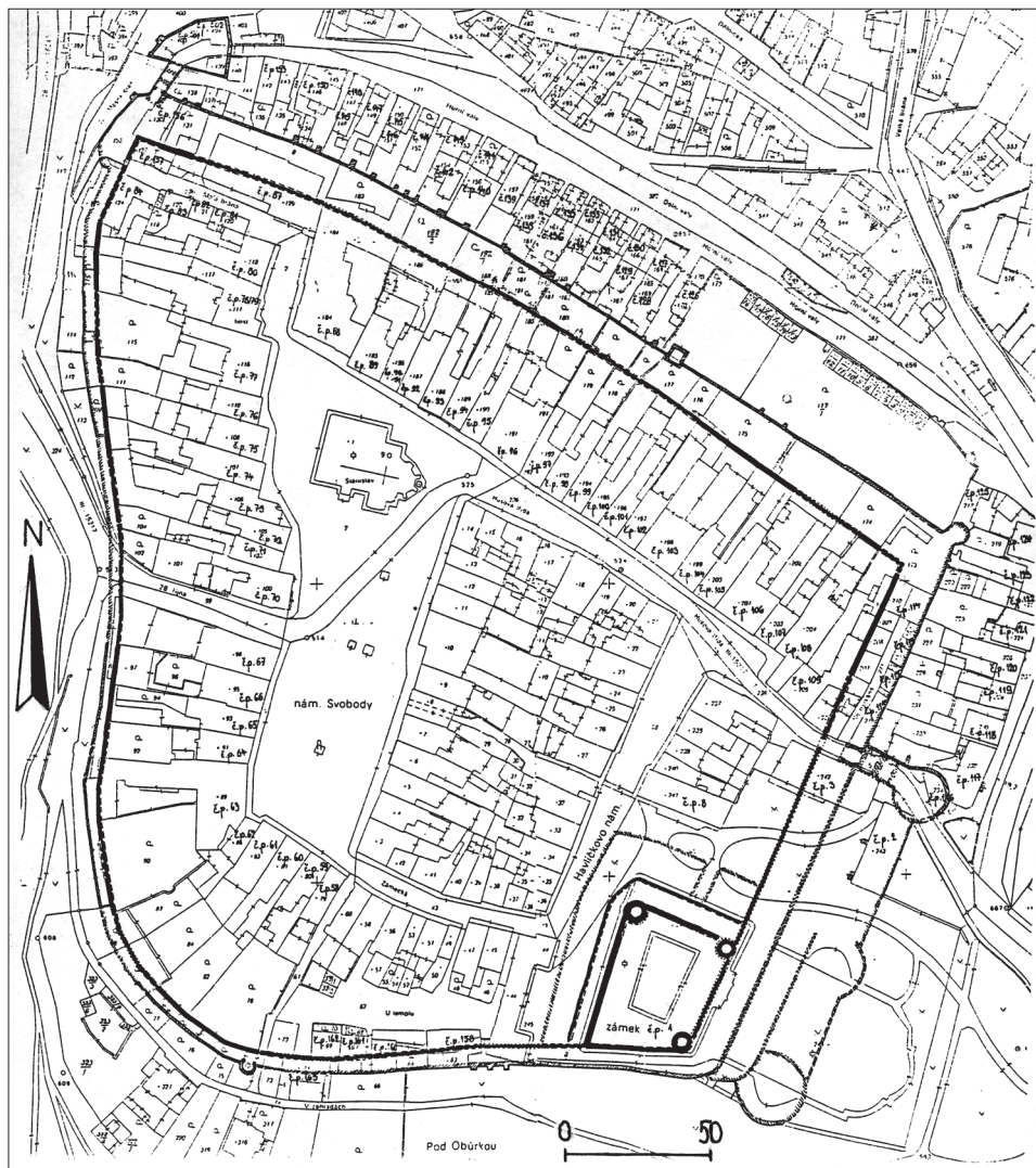
Obr. 6. Doplněný fortifikační systém města a hradu na bázi soudobého katastrálního plánu podle SHP hradeb (zpracoval M. Plaček v letech 1997–1999).