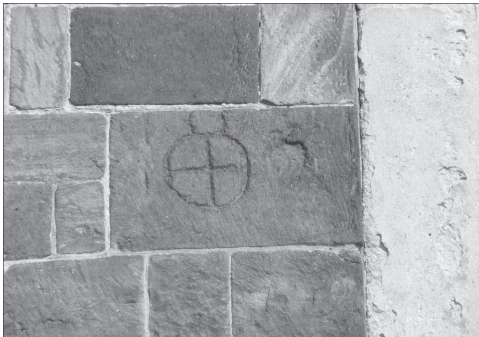
Obr. 4. Plaňany, okr. Kolín, kostel Zvěstování Panny Marie. Rytý kříž na jižní stěně lodi.

Abb. 4. Plaňany, Bezirk Kolín, Kirche Mariä Verkündigung. Eingeritztes Kreuz an der Südwand des Kirchenschiffs.