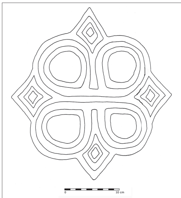
Obr. 5. Telč, okr. Jihlava, kostel sv. Ducha. Rytý pletenec na jihovýchodním nároží věže (Bláha-Konečný 2005, 141).

Abb. 4. Plaňany, Bezirk Kolín, Kirche Mariä Verkündigung. Eingeritztes Kreuz an der Südwand des Kirchenschiffs.