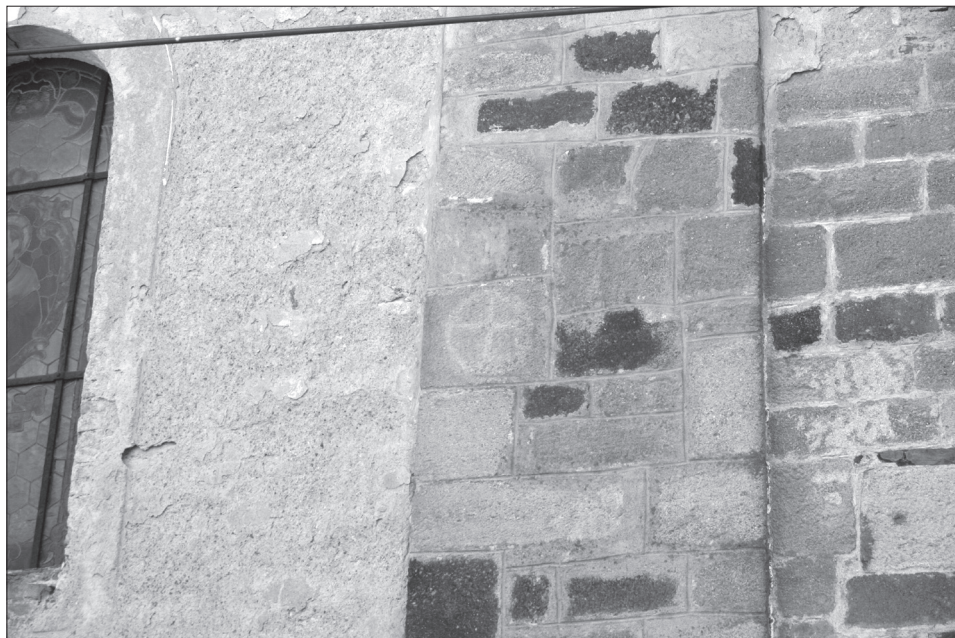
Obr. 2. Svojšíň, okr. Tachov, kostel sv. Petra a Pavla. Rytý kříž v horní části lizény na severní stěně lodi. Foto M. Čechura, 2006.