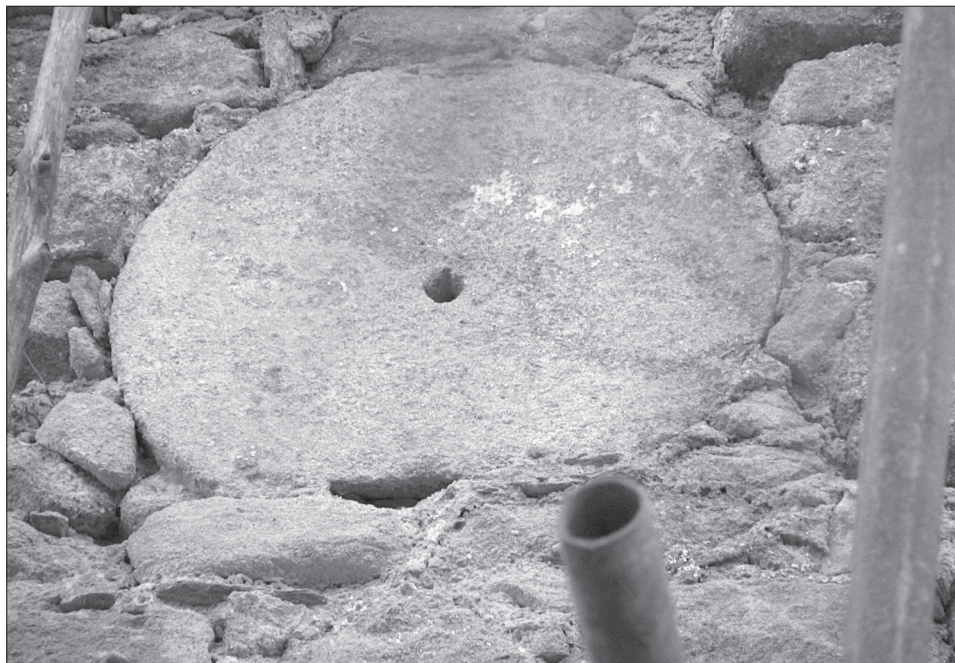
Obr. 10. Ostrovec, okr. Plzeň-sever, kostel sv. Jana Křtitele. Druhotně použité saccharium ve zdi kostela. Foto M. Čechura, 2006.