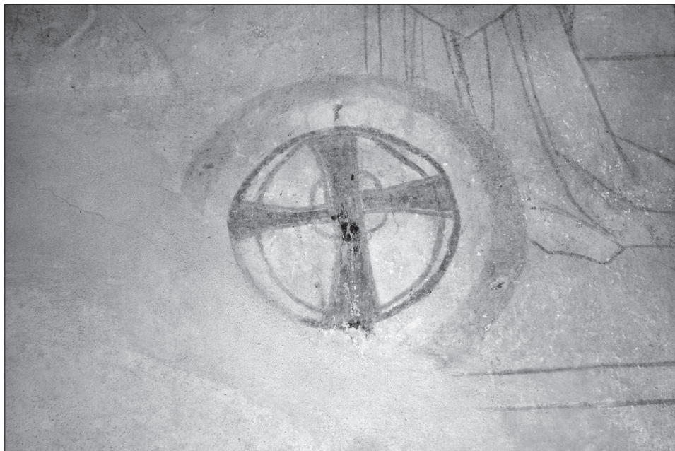
Obr. 6. Starý Plzeňec, okr. Plzeň-jih, kostel Narození Panny Marie. Konsekrční kříž na jižní stěně presbytáře. Foto M. Čechura, 2009.

Abb. 6. Starý Plzeňec, Bezirk Pilsen-Süd, Mariä Geburtskirche. Konsekrationskreuz (Weihekreuz) an der Südwand des Presbyteriums. Foto Čechura, 2009.