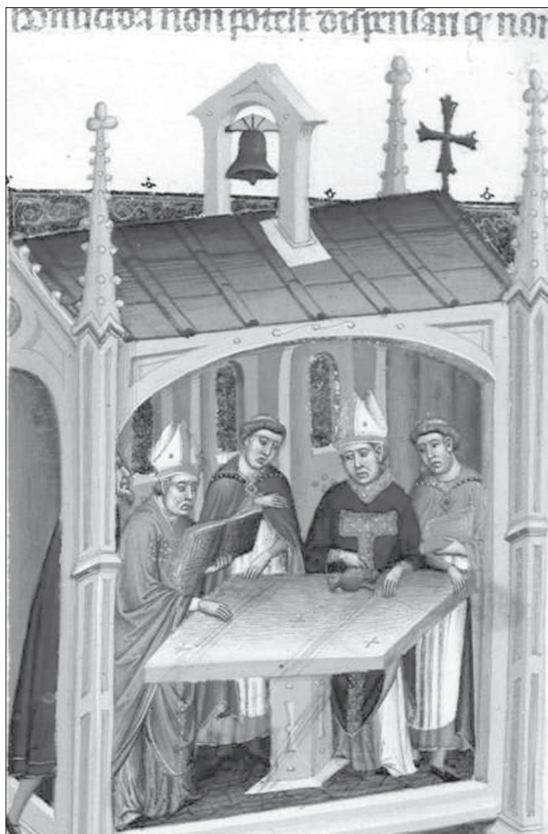
Obr. 9. Svěcení oltáře. Iluminace z rukopisu Decretum Gratiani . British Library, sign. Add. 15275, fol. 142v.