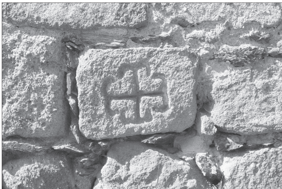
Obr. 3. Kostelec, okr. Tachov, kostel sv. Jana Křtitele. Rytý kříž na kvádru druhotně umístěném ve zdivu lodi. Foto M. Čechura, 2007.