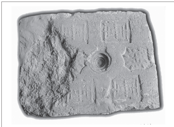
Obr. 1. Milevsko, okr. Písek, bazilika Navštívení Panny Marie. Lapis primarius ze základů presbytáře (Břicháček 2007, 34).

Hmotnými prameny odrážejícími rituály při zakládání kostela jsou základové kameny (lapis primarius). Dobře byl zdokumentován základový kámen s rytinou latinského kříže ve zdivu základů rotundy sv. Klimenta na Levém Hradci. Kříž byl do kamene vyryt jako součást obřadu při usazování do zdiva nebo do již předem umístěného kamene. Rituál spojený s pokládáním základního kamene se v západní Evropě objevuje během 13. století a jeho průběh byl kodifikován v základních liturgických příručkách (Sommer 1997, 588–591). Zvláštní formu lapis primarius představuje terakotový kvádr zdobený kolky, nalezený při v základech raně gotického závěru baziliky premonstrátského kláštera v Milevsku (Břicháček 2007, 34). Průběh zakládacího rituálu s řadou archeologicky obtížně doložitelných jevů popisuje např. opat Suger při popisu přestavby katedrály St. Denis (Spisy 2006, 121–195). Řadu příkladů z německého prostředí shromáždil M. Untermann (2003).