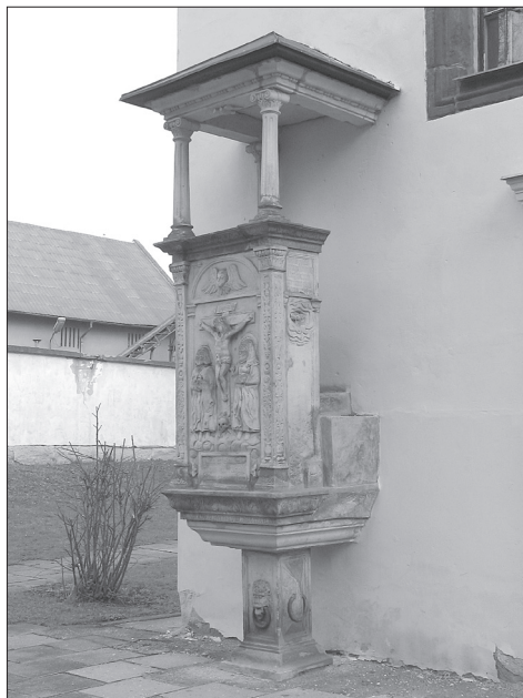
Obr. 12. Český Brod, okr. Kolín, kostel Nejsvětější Trojice. Kazatelna před západním průčelím kostela.