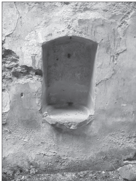
Obr. 11. Otín, okr. Tachov, kostel Jména Panny Marie. Lavabo ve stěně sakristie.