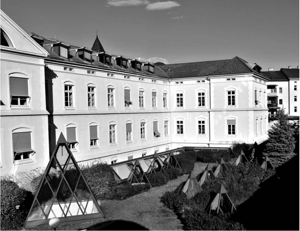
Abb. 1: Das seit 1995 in der Michael-Gaismair-Straße befindliche Tiroler Landesarchiv.

Die Epoche Maximilians I. (1490–1519) bedeutete einen Quantensprung für das Innsbrucker Schatzarchiv; Hand in Hand mit grundlegenden Verwaltungsformen, 7 die in der Grafschaft Tirol und in den Vorlanden ihre erste Erprobung erfuhren, plante der Tirol emotional stark verbundene Kaiser die Schaffung eines zentralen Archivs für das Reich und die Erblande. Auch wenn dieser kühne Plan nicht vollständig umgesetzt wurde, befanden sich doch zum Zeitpunkt des Todes des Herrschers (1519) die Masse der maximilianischen Hof- und Reichskanzlei – zum Teil in Verflechtung mit dem Schriftgut der oberösterreichischen Behörden und größeren Teilen des habsburgischen Familienarchivs – in Innsbruck. 8