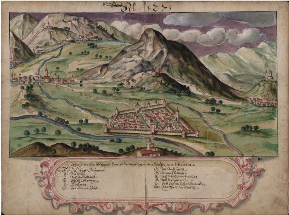
Abb. 11: Die Stadt Glurns im Vinschgau, ca. 1615 (TLA, Landschaftl. Archiv, Hs. 3)