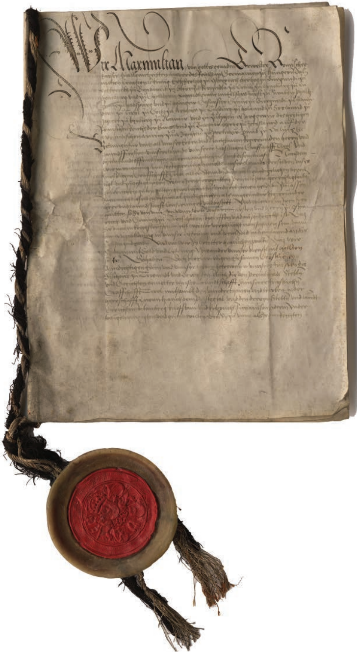
Abb. 8: Landlibell (Zuzugsordnung) Maximilians I. für die Grafschaft Tirol, 1511 (TLA, Landschaftl. Archiv, Urk. 32)