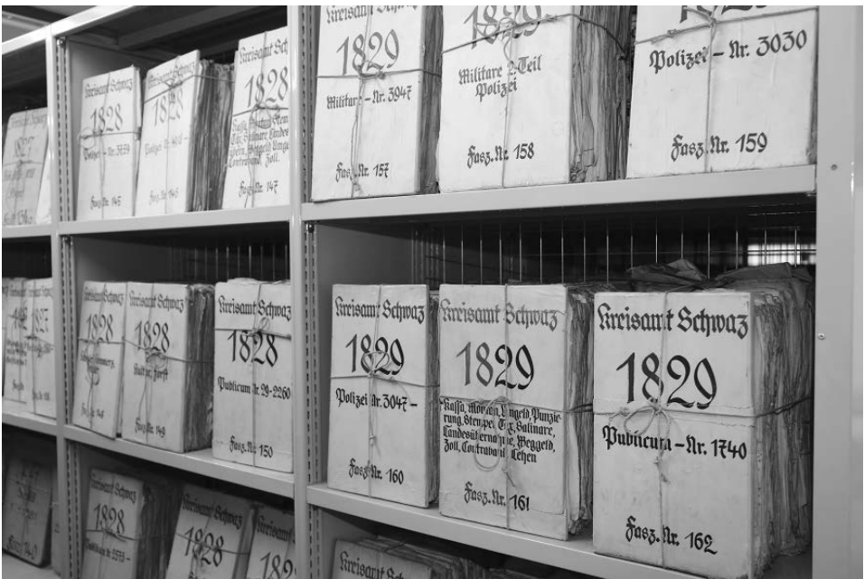
Abb. 3: Ein Depot mit in Faszikeln aufbewahrten Akten (Foto: TLA).