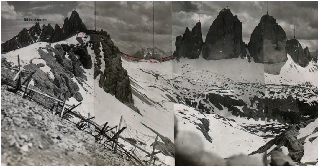
Abb. 14: Gefechtsfeldaufnahmen von den italienischen Stellungen in den Sextener Dolomiten (Drei Zinnen), Juli 1917.

auch das Archivwesen grundlegend verändert. Die Einführung des Computers bzw. der EDV in den 1990er Jahren bedeutete für das Tiroler Landesarchiv zunächst, dass das, was bisher handschriftlich oder mit der Schreibmaschine gefertigt wurde, durch den Computer geschah und erste Verzeichnisse bzw. Datenbanken – meist in den Formaten word, excel und access – entstanden. Damit waren noch keine grundlegenden Veränderungen in der Arbeitswelt des Archivars verbunden, allerdings wurden Überarbeitungen etc. erleichtert und die Möglichkeiten der Erschließung und Suche verbessert und verfeinert.