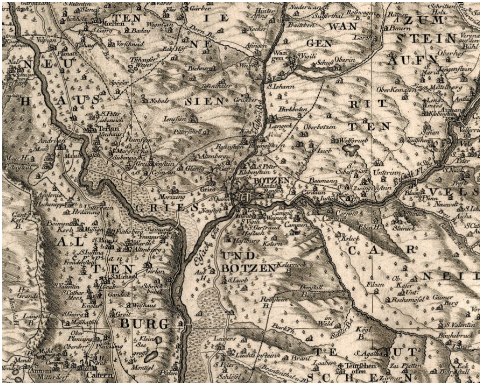
Abb. 13: Atlas Tyrolensis von Peter Anich, Ausschnitt Bozen, 1774 (TLA, Bibl. K 34)

In enger Zusammenarbeit mit dem Lesesaal bzw. den Bearbeitern der telefonischen und schriftlichen Anfragen stellt der Reproduktionsdienst des Tiroler Landesarchivs gegen Kostenersatz mehr als 30.000 Scans und ca. 35.000 Kopien her (in diesen Zahlen sind auch Sicherheitsdigitalisierungen und Kopien für den internen Gebrauch inbegriffen); infolge der Onlinestellung der Matriken (Dezember 2015) wird sich die Zahl der Rückvergrößerungen aus den mikroverfilmten Kirchenbüchern (2015: ca. 6.000 Stück) in den nächsten Jahren stark reduzieren. 47 Das Fotografieren durch Benutzer ist im Lesesaal des Tiroler Landesarchivs nicht gestattet, jedoch steht seit 2018 ein Selbstbedienungsscanner im Lesesaal zur Verfügung.