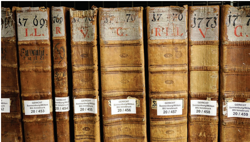
Abb. 12: Verfachbücher (Vorläufer des Grundbuchs), ca. 1770 (TLA, Verfachbücher LG Sonnenburg)