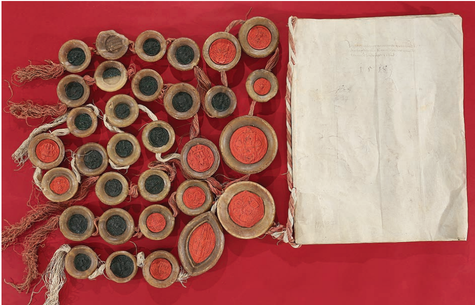
Abb. 9: Ordnung zur gegenseitigen Kriegshilfe der österreichischen Erblände, 1518 (TLA, Landschaftl. Archiv, Urk. 37)

Im Zuge der von 1806 bis 1814 währenden Zugehörigkeit Tirols zum Königreich Bayern wurde das österreichische Serienaktenprinzip durch ein konsequent nach Betreffenden gegliedertes Ablagesystem ersetzt, dem ein für das gesamte Königreich Bayern einheitlicher Aktenplan zugrunde lag. Die österreichische Verwaltung kehrte allerdings nach 1815 wieder zu ihrem alten System zurück. Erst mit der Auflösung der Zentralregistratur 1911 und der Schaffung von Abteilungsregistriaturen wurde den immer komplexer werdenden und sich stärker differenzierenden Verwaltungsaufgaben Rechnung getragen, sodass heute ein Mischsystem Anwendung findet, das mittels detaillierter und thematisch gegliederter Aktenpläne Elemente des Sachaktenprinzips aufgreift, jedoch innerhalb der Betreffenden immer noch dem Serienaktenprinzip folgt.