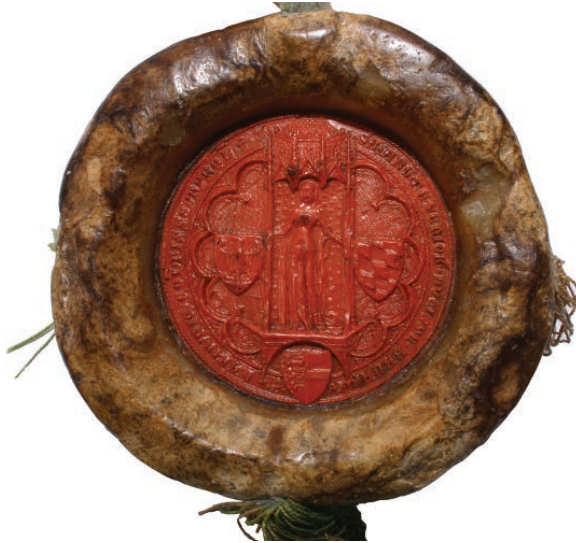
Abb. 6: Siegel der Margarethe Maultasch, 1363 (TLA, Urk. I 9789)

(15.12.1943, 16.12.1944) und einer irrtümlichen Vernichtung von ausgelagerten Archivalien (1946) verlorengegangenen Schriftguts betrug rund 3,5 % des Gesamtbestandes; im Vergleich dazu werden die Extraditionen nach dem Ersten Weltkrieg mit rund 13,5 % berechnet. 22