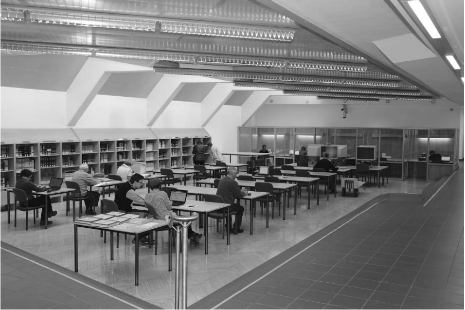
Abb. 2: Der Lesesaal des Tiroler Landesarchivs.