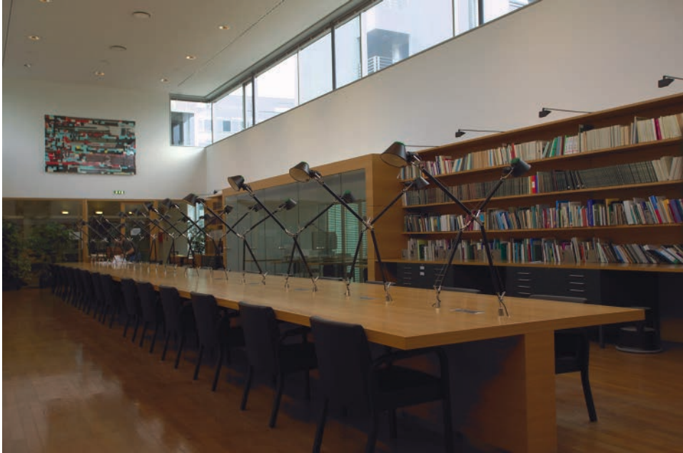
Abb. 4: Lesesaal des Niederösterreichischen Landesarchivs (Foto: NÖLA).

disches Archiv und Regierungsarchiv nicht nur aus historischen und archivischen Gründen, sondern schon wegen der räumlichen Zwänge aufrecht. 9