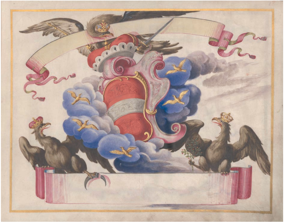
Abb. 6: Wappenbuch der ständischen Verordneten, fol. 4 mit der bildlichen Darstellung: Apotheose des niederösterreichischen Landeswappens: Bindenschild mit Erzherzogshut umgeben von blauen Wolken und fünf goldenen Lerchen (irrig anstelle von Adlern), den Motiven des niederösterreichischen Landeswappens – begleitet von Adlern, die mit der rudolfinschen Hauskrone (der späteren österreichischen Kaiserkrone) sowie der ungarischen Stephanskronen (Adler mit zerbrochenem Halbmond!) und der böhmischen Wenzelskrone bekrönt sind. Alle drei Kronen sind allerdings historisch nicht exakt dargestellt (NÖLA, Sign. StändWappenB – Verord; Foto: NÖLA, Wolfgang Kunerth).

zu erwartenden Übernahmen bewältigen zu können. 13 Weitere Baumaßnahmen werden nötig sein.