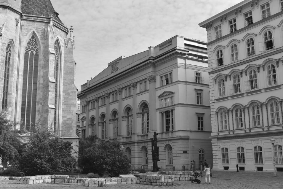
Abb. 1: Das alte Landhaus (heute Palais Niederösterreich), in dem bis zu ihrer Übersiedlung in die Teinfaltstraße 8 im Jahr 1968 die Abteilung Ständisches Archiv untergebracht war. Rechts davon der ehemalige Sitz der niederösterreichischen Landesregierung, des Regierungsgebäude (heute Außenministerium), in dem sich die Direktion und die Abteilung Regierungsarchiv des Niederösterreichischen Landesarchivs bis 1997 befanden.

Jahre später erfolgten die ersten Schritte in der Entwicklung zum modernen Archiv: 1705 legte man ein Verzeichnis aller Urkunden an, 1717 bis 1723 wurde die Registratur neu geordnet und mit dem Codex provincialis ein universeller Findbehelf geschaffen. 3 Nach den Franzosenkriegen gab es erste Überlegungen, einen wissenschaftlichen Archivdienst zu installieren, die Revolution von 1848 beendete allerdings alle Planungen. Erst im Zusammenhang mit der 1861 erfolgten Schaffung der Landtage im Rahmen der konstitutionellen Monarchie wurde das „Ständische Archiv“ 1863 durch Trennung von der Registratur und Einführung eines wissenschaftlichen Archivfachdienstes zum Niederösterreichischen Landesarchiv. 4 Nach dem Zusammenbruch der Donaumonarchie blieb das Archiv als separate Einrichtung bestehen und wurde 1923 Bestandteil der sogenannten Niederösterreichischen Landessammlungen, zu denen auch das Landesmuseum und