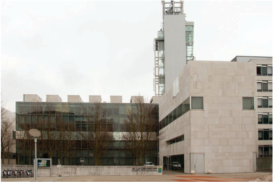
Abb. 2: Der neue Standort des Niederösterreichischen Landesarchivs (Haupthaus) im Regierungsviertel in St. Pölten (Foto: NÖLA).

die Landesbibliothek gehörten. 5 Das Archiv „überlebte“ 1938 zunächst auch den Anschluss an das Dritte Reich bis 1940.