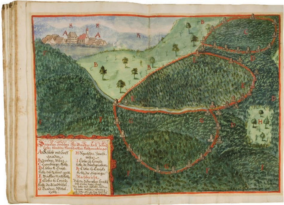
Abb. 8: Metilustrium Sanctae Crucis Nemorosum (Handschrift mit Grenzbegehung der Wälder von Heiligenkreuz, Abb. von Schloss und Dorf Gaaden) (NÖLA, Sign. HS StA 1316).

seine Bestände laufend mit dem Archivinformationssystem AUGIAS, ermöglicht so auch elektronische Bestellungen für die Benützung sicher und stellt digitalisierte Bestände über dieses System im Web zur Verfügung. 15