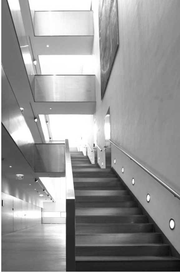
Abb. 5: Das Stiegenhaus des Niederösterreichischen Landesarchivs (Haupthaus) (Foto NÖLA).

schließlich ohne Veränderung seines Status als Abteilung K2 – Niederösterreichisches Landesarchiv und Niederösterreichisches Institut für Landeskunde der neu geschaffenen Gruppe K – Kultur, Wissenschaft und Unterricht zugeordnet. 1997 übersiedelte es in das neue Haus nach St. Pölten. Ausgenommen die Außenstelle in Bad Pirawarth, waren damit erstmals in der Geschichte des Hauses alle Referate und das Institut für Landeskunde unter einem Dach vereint. 12 Sehr bald aber wurde klar, dass der Neubau für die zu erwartenden Zuwächse nicht ausreichen würde. Seit 2005 entstand daher in St. Pölten ein zusätzlicher neuer Depotbau, der allerdings wieder nicht ausreichend groß ist, um die in den nächsten Jahren