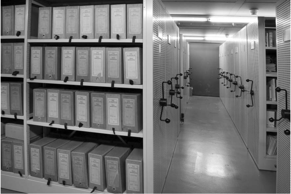
Abb. 3: Blick in das Depot des Niederösterreichischen Landesarchivs (Haupthaus).

brachte erst das Wirken des wohl bedeutendsten kaiserlichen Statthalters des Erzherzogtums unter der Enns, nämlich Erich Graf Kielmanseggs (1887–1911). Er plante seit 1891 die Errichtung eines eigenen Archivs für die k.k. Statthalterei. Das k.k. Ministerium des Inneren stimmte dem 1893 zu, es dauerte aber noch bis 1897, dem neuen Archiv seine endgültige Form zu geben. 7 Dazwischen lagen die Einstellung zweier akademisch ausgebildeter Archivare 1893, eine erste Verzeichnung der Bestände 1894 und schließlich 1897 eine Archivordnung. 1918 blieb das Archiv für Niederösterreich als selbständige Institution bestehen, das heißt, daß in Niederösterreich weiterhin zwei selbständige Archive parallel existierten.