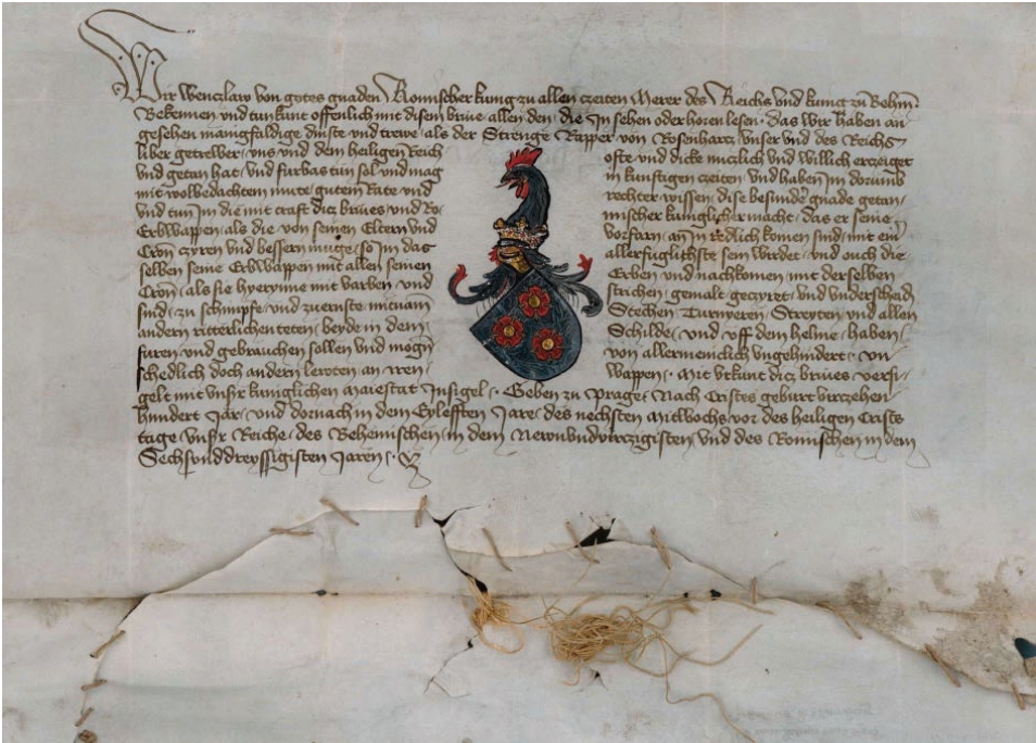
Abb. 10: König Wenzel IV. von Böhmen gewährt Rapper von Rosenharts das Recht, sein Erbwappen mit einer Krone zu zieren, 23. Dezember 1411 (NÖLA, Sign. StA Urk. 1818).

nen (16.–20. Jahrhundert). Ein wesentlicher Bestand sind auch die Bezirkshauptmannschaften. Ein dem Archivkörper erst in den letzten Jahren zugewachsene Bestandsgruppe ist das Agrarwesen. Hier sind die Akten der Bezirksbauernkammern sowie Spezialbestände aus dem Bereich der Landeslandwirtschaftskammer und des Revisionsverbandes zu nennen.