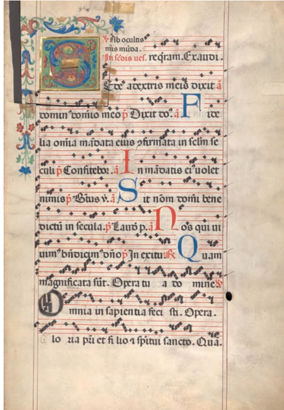
Abb. 3 Pressburger Antiphonar III EC Lad. 6 (Staatsarchiv Pressburg, f. 30r).

bezeichnete diesen Notationstyp als Metzger-gotische Graner Mischnotation. 20 Dieses Mischzeichensystem war ein vielbenutzter Notationstyp in der zweiten Hälfte des 15. und am Beginn des 16. Jahrhunderts. Es wurde vor allem in den zentralen ungarischen Skriptorenwerkstätten verwendet Gran und Buda verwendet. 21