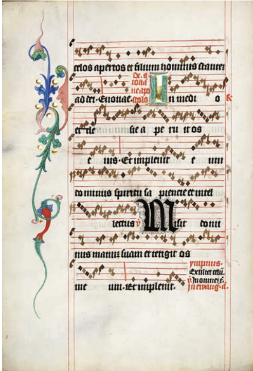
Abb. 1 Pressburger Antiphonar IIb SNA 4 (Slowakisches Nationalarchiv, f. 2v). 16