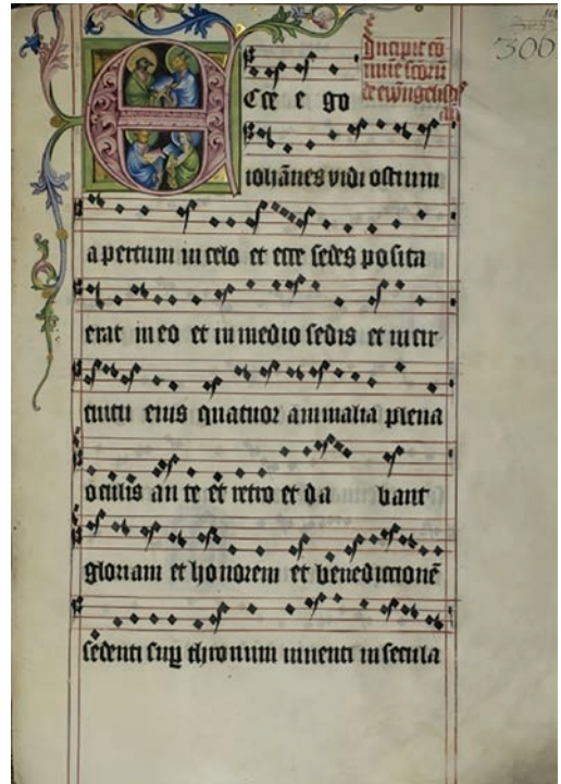
Abb. 2 Klosterneuburger Antiphonar Cod. 65 (Augustiner-Chorherrenstift Klosterneuburger Antiphonar Cod. 65 (Augustiner-Chorherrenstift Klosterneuburg, Stiftsbibliothek Klosterneuburg CCI 65, f. 302r). 17

Die veränderte Ästhetik der Kodizes vom Ende des Mittelalters nach dem Vorbild der italienischen Renaissance und des königlichen Skriptoriums in Buda wird einzig und allein nur durch das Budaer/Pressburger Antiphonar III (EC Lad. 6, Staatsarchiv Pressburg) dokumentiert. Ausschmückung, Schrift und Notationsstrukturen wurden durch die humanistischen Tendenzen und Usancen im Ofner Skriptorium beeinflusst. 19 In dem Kodex taucht eine spezifische Notation auf, die als Folge der Reformprozesse in der Buchkultur der zweiten Hälfte des 15. Jahrhunderts zu betrachten ist. Diese Kontaktnotationsschrift, die nicht als reine Metzger-gotische Notation angesehen werden kann, enthält mehrere archaische Strukturelemente der Graner Notation. Janka Szendrei