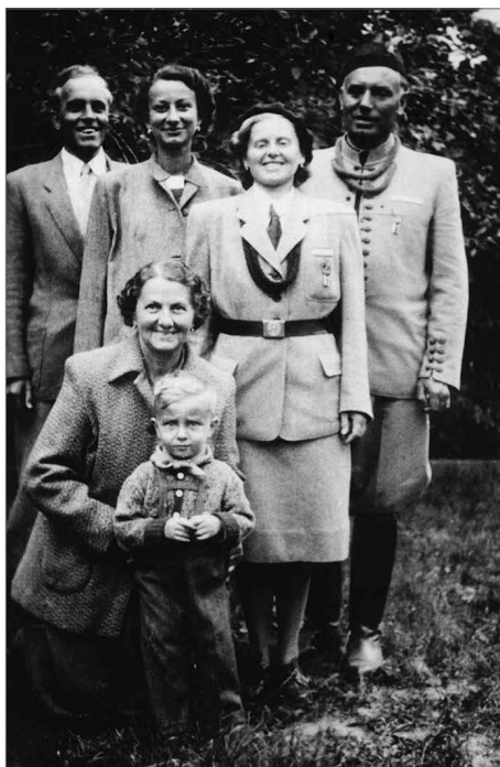
Obr. 2. XI. Všesokolský slet, Praha 4. července 1948.