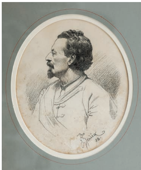
Obr. 1. Miroslav Tyrš. 1883. Autor: František Ženišek. Kresba uhlím.