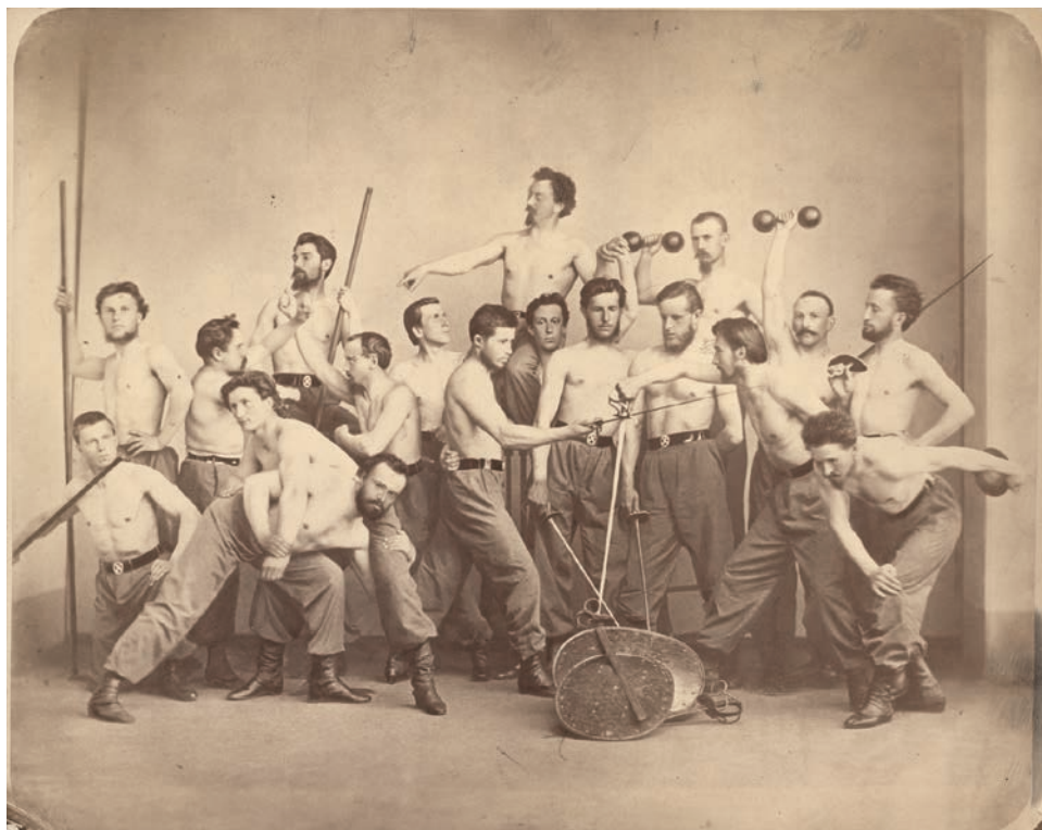
Obr. 9. Cvičitel'ský sbor Sokola Pražského v r. 1864. Fotografie byla pořízena v témže roce, kdy se sokolové přeli o míru odhalenosti těla při cvičení. Zdroj: Národní muzeum, Sbirka tělesné výchovy a sportu, inv. č. H7F-46781.

tomu bylo v antice. Právě ona přímá ostenze těla určovala jasné parametry tvorby českého maskulinního konstrukt, který se měl stát součástí národní identity. Takové ukazování nebylo duchaprosté – v estetické hodnotě těla měla být realizována vnitřní etika každého cvičence.