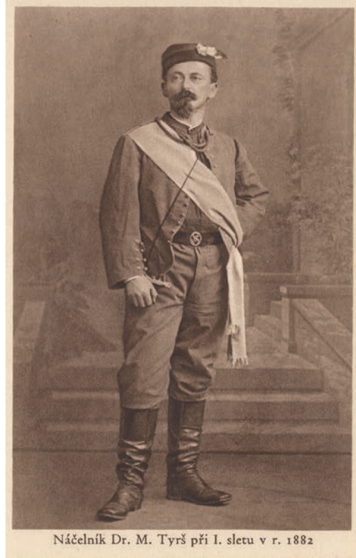
Náčelník Dr. M. Tyrš při I. sletu v r. 1882

Zdroj: Národní muzeum, Sbírka tělesné výchovy a sportu, inv. č. H7H- 19330.