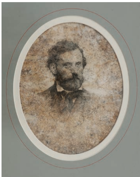
Obr. 2. Jindřich Fügner. 1883. Autor: František Ženišek. Zdroj: Národní muzeum, Sběrka tělesné výchovy a sportu, inv. č. H7H-15596.

lem tvarování těla vytvořený způsob jednání může být považována za normu chování stejně jako spolková doporučení obecnějšího charakteru. Především Miroslav Tyrš spolu s dalšími reprezentanty sokolského hnutí je prostřednictvím psaných textů nebo veřejných promluv při kulturních performancích sdělovali řadovým členům spolku a širšímu obecenstvu. Definovali tak nový sémioticko-fenomenální typ těla uskutečňovaného pohybem, jehož byli sami názorným příkladem.