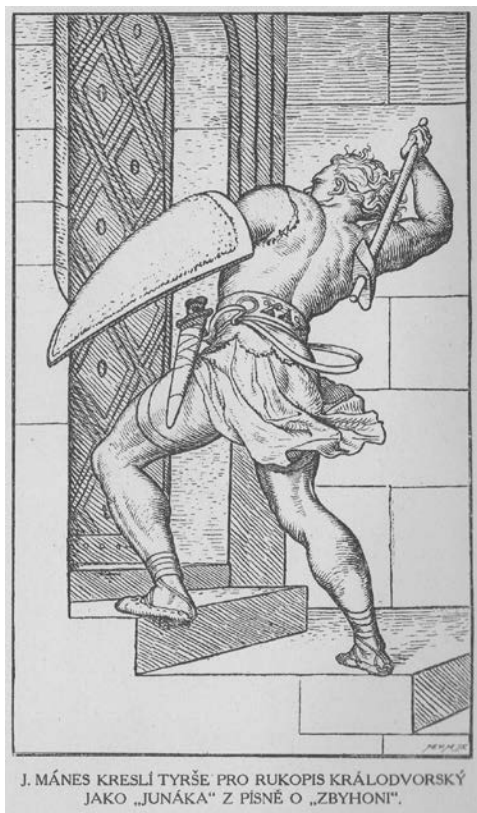
Obr. 12. Kresba junáka do Rukopisu královedvorského . Kolem roku 1858.