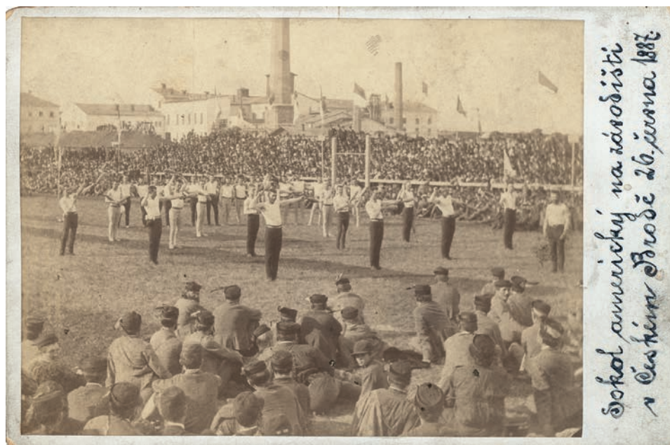
Obr. 4. Cvičení protná mužů v Českém Brodě při návštěvě amerických sokolů v r. 1887. Z fotografií zachycujících cvičení protná, konaná při různých příležitostech, je patrná vzájemná spolupřítomnost a významotvorná interakce obecnstva a aktérů a také jednotlivý tělesný pohyb, opanující mysl cvičenců.