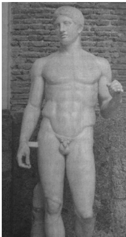
Obr. 6. Polykleitův Doryforos.

Zdroj: Národní muzeum, Sbirka tělesné výchovy a sportu, inv. č. H7F-61297.