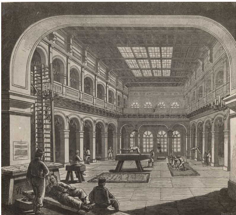
Obr. 7. Tělocvična Sokola Pražského. Interiér. Autor kresby: František Chalupa, 1868.

Tento performativní aspekt konstruování sokolských těl přirozeně ovlivňoval podobu cvičebního oděvu a naopak. Zpočátku se cvičilo v neformálních košilích či německé „turnjacke“ a v kalhotách střižených podle turnerských vzorů. 174 Místo tohoto cvičebního úboru byl ale již pro zápas při veřejném cvičení Sokola Pražského, konaném 1. března 1863 na oslavu ročního výročí jeho založení, doporučen oděv skládající se z plátěných kamašů a červeného trikotu. 175 Dnes bychom tehdejší trikot pravděpodobně označili výrazem nátělník, jelikož se jednalo o tělo obepí-