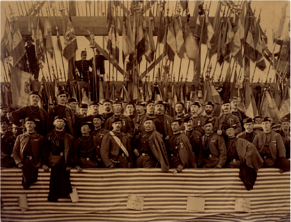
Obr. 14. Sokolové na gymnastických závodech v Paříži v r. 1889. Prostřednictvím sokolského kroje a praporu byl reprezentován český národ zatím neexistující v rámci samostatného státu. Zdroj: Národní muzeum, Sběrka tělesné výchovy a sportu, inv. č. H7F-24014.

identitu. Při odkládání kroje tak každý člen mohl spolu s ním odložit také svou kolektivní identitu a naopak.