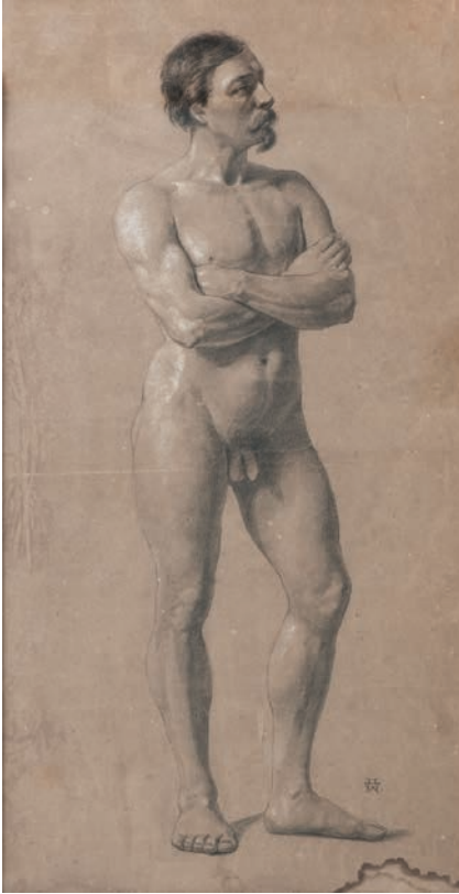
Obr. 10. Akt Miroslava Tyrše. Mezi r. 1850–1852.