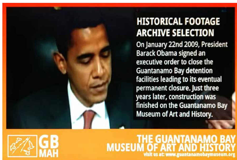
Obr. 3: Ukázka díla fiktivního muzea Guantanamo Bay Museum of Art and History na výstavě How much of this is fiction? prezentované v liverpoolském centru FACT v roce 2017. Fotografie nabízí pohled na fiktivní zprávu o uzavření detenčního tábora v Guantanamo Bay a vytvoření muzea na jeho místě.

Interpretace a prezentace těžkých i kontroverzních témat v muzejní expozici s sebou nese mnoho rizik, která souvisejí nejen s osobností učícího se jedince a jeho psychickým a poznávacím systémem, ale i politickým smýšlením ve společnosti. Na tenký led se mohou při interpretaci takových témat muzea a galerie dostat právě tehdy, kdy jejich interpretace a způsob prezentace daného tématu není v souladu s převládajícím konsensem ve společnosti, kdy takové interpretace rozrušují obecné společensko-politické poměry, podřívají přijatou ideologii a celkově nezapadají do kolektivní či národní paměti dané historické události. 11 Muzea