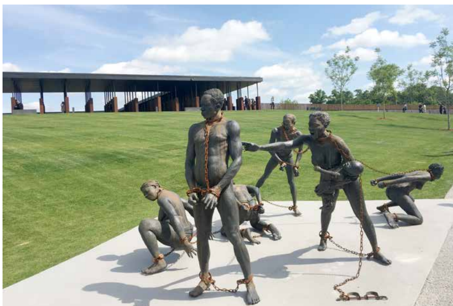
Obr. 4: Umělecké dílo instalované u vstupu do areálu pomníku National Memorial for Peace and Justice věnovaného obětem rasové nespravedlnosti v USA.