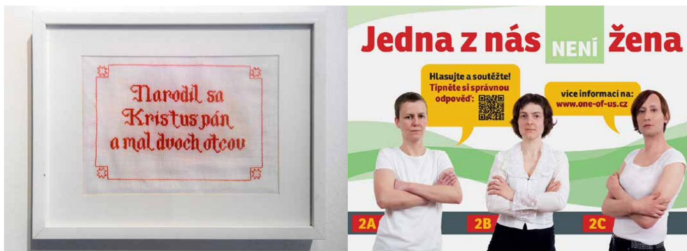
Obr. 1–2: Ukázka děl prezentovaných na výstavě Hate Free? v Centru současného umění DOX v roce 2016, reflektující problémy současné společnosti.

Lord a Nгаire Blankenberg považují měkkou moc muzeí a její aktivní využívání za jeden z hlavních faktorů přeměny, jíž prochází základní role muzea od poloviny 20. století a jejímž klíčovým rysem je budovat muzea jako aktivní vzdělávací centra, sloužící široké veřejnosti a podněcující k multikulturní debatě. 3 A právě proto, aby byla muzea aktuální a aktivně se vyjadřovala k dění ve společnosti, musí nutně řešit i témata těžká a kontroverzní.