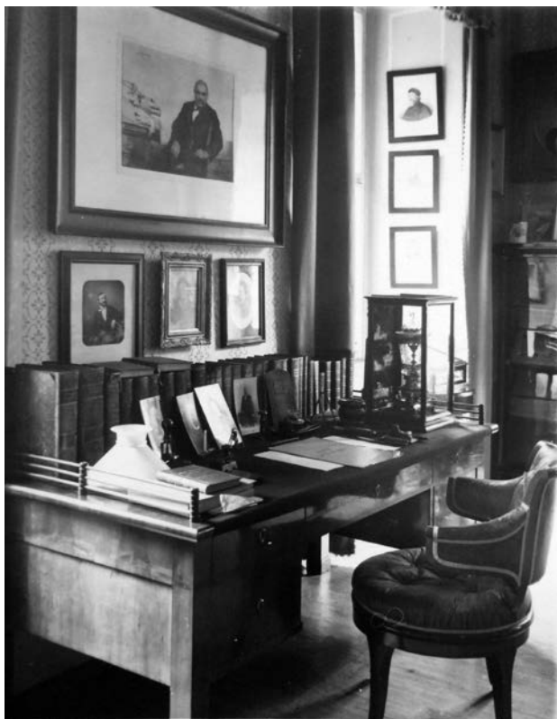
8 Pracovní stůl Františka Ladislava Riegra v jeho pracovně v Malči, stav v meziválečném období.

Palacký věnoval až pedantickou péči každodennímu pozorování počasí a zaznamenávání si meteorologických údajů do svého deníku. 138