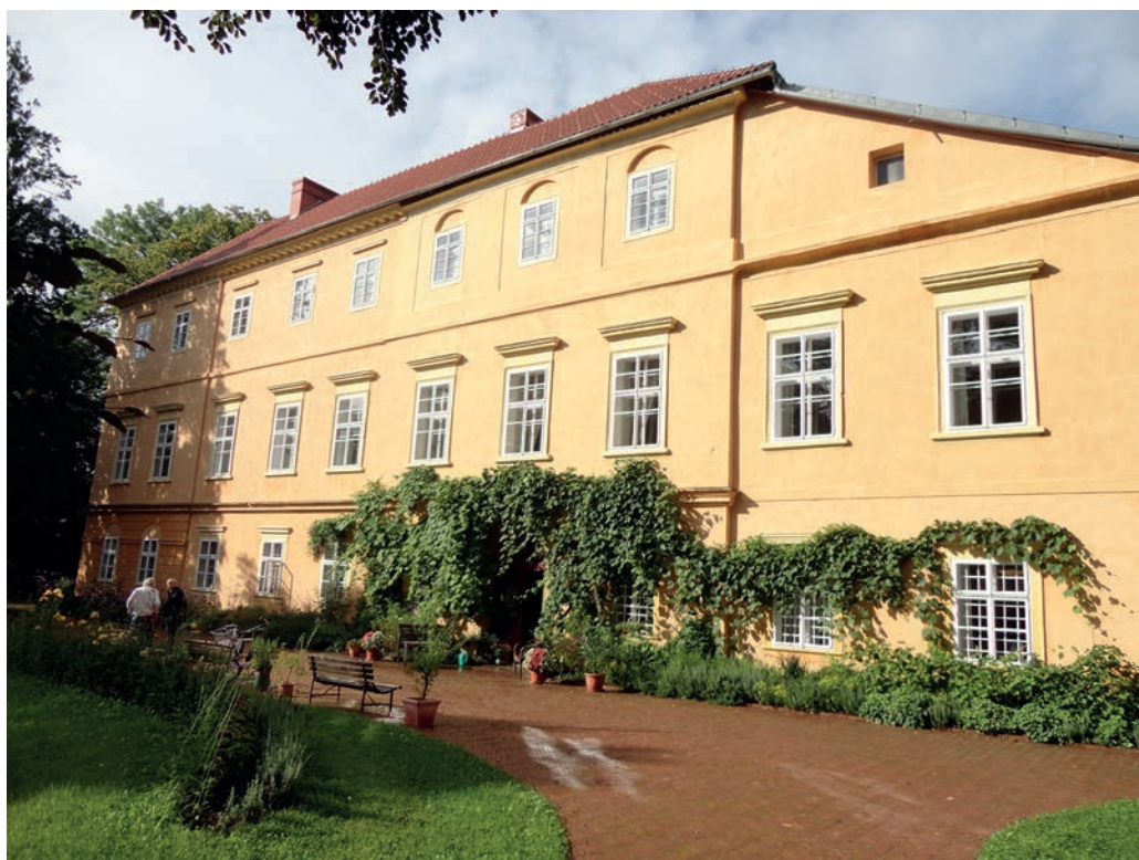
1 Zámek Maleč, dnešní stav.