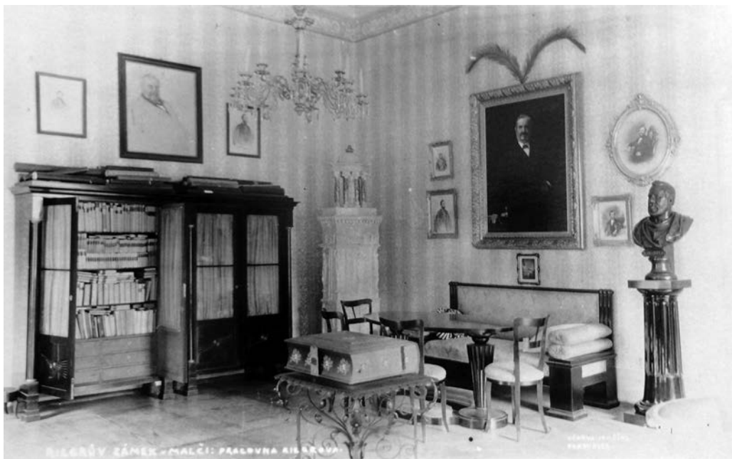
5 Pracovna Františka Ladislava Riegra v Malči, stav v meziválečném období. (Archiv Národního muzea, fond Bohuš Rieger ml., kart. 13, Fotografie Malče, inv. č. 560.)