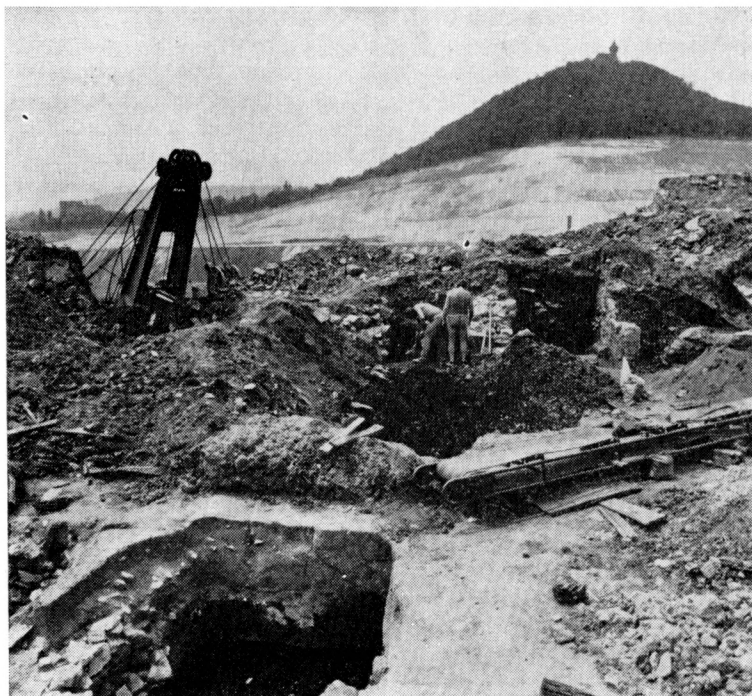
Obr. 1. Výzkum v historickém jádru města Mostu, léto 1977.