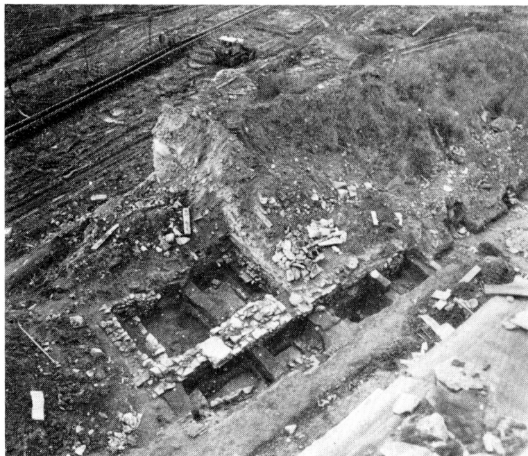
Obr. 2. Most, Nejedlého ul. Pohled na výzkum zemnic u čp. 19 a 18.