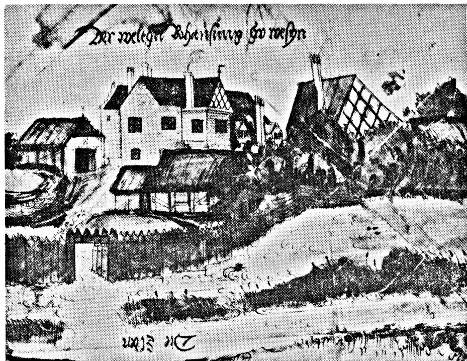
Obr. 3. Panské sídlo ve Welsinu (1540).