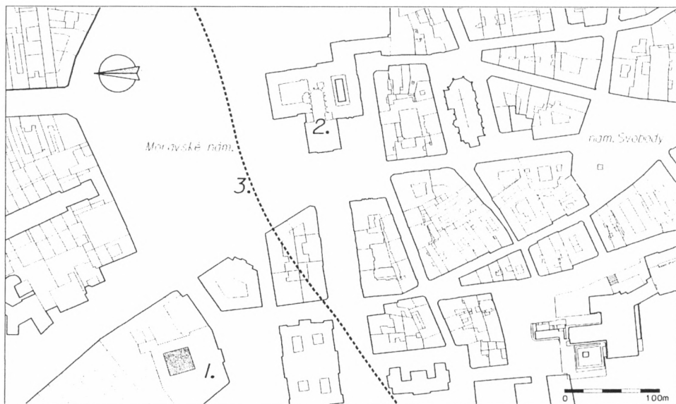
Obr. 1. Situace lokality v rámci Brna, 1. plocha výzkumu, 2. kostel sv. Tomáše, 3. předpokládaná vodoteč potoka.