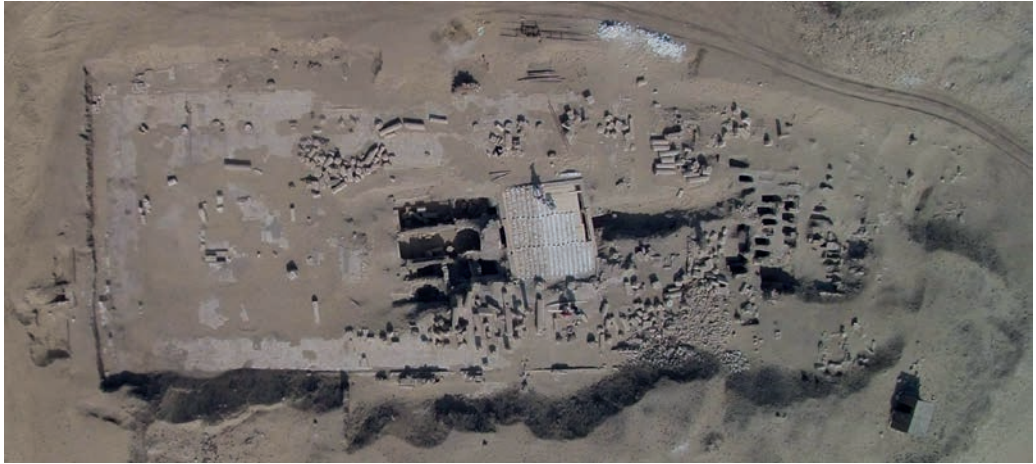
Figura 2. Foto aérea de la basílica en 2016.

Por otra parte, los papiros que hacen referencia a la basílica son también numerosos, 3 pero solo algunos de ellos como el P.Oxy. 16 1950 nos da una cronología específica de la utilización del sector como basílica, la fecha del 24 de enero del 487 d.C. Otro papiro, el P.Oxy. 16 2041, fechado a finales del siglo VI nos habla de la reforma arquitectónica que se produjo en la basílica de San Filóxeno para su reconstrucción, papiro estudiado con detalle por Papaconstantinou (2005), o el P.Oxy. 11 1357 sobre el calendario estacional de la ciudad que nos habla sobre la festividad de este santo el día 22 del mes de Khoiak (18 de diciembre), así como la importancia de este mártir, san Filóxeno, entre los más destacados de la ciudad (Papaconstantinou 1996: p. 150).