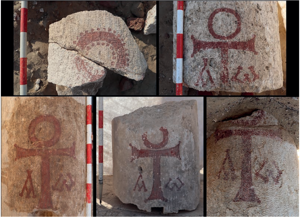
Figura 4. Fotocomposición con algunas de las cruces ansadas encontradas en la basílica.