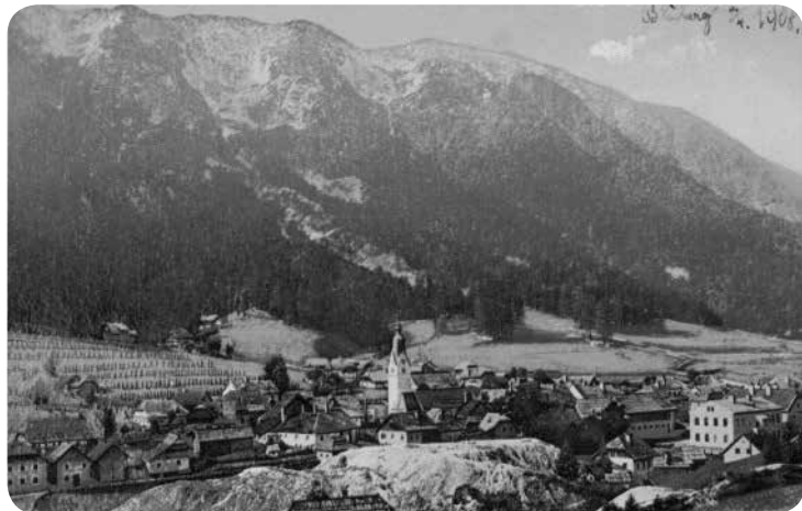
7. Bad Bleiberg a Dobrač na po- hlednici z r. 1908

aj.: „Tajemná přírody moc po tisíciletí budovala ledové to pole, jehož příšerná bělost přecházející v magické modro neb zeleno, zdá se nám haliti i tajiti postavy pohádkové. Nedivíme se, že horalé, žijící v nejbližší blízkosti divuplné té ledové říše, vybájili si celý svět báchorek.“ (Řeháková 1891: 141) Zase jinde: „Pohled s vrcholu v celou tu spoustu horskou, jevící se rozbouřeným obrovským okeanem, jenž pojednou zkameněl, uchvátí každého, vzdělance i muže prostého.“ (Řeháková 1891: 150) V uvedených citátech je patrný pro Řehákovou typický emotivní způsob líčení (vyzdvihujeme její často i jinde používané výrazy jako příšerný, magický, kouzlí, pohádkový, divuplný, zázračný, obrovský, ohromující, uchvátí, báchorky), kterým čtenářům přibližuje dotyčnou krajinu. O to větší škoda, že většina jejích knih není doplněna fotografiemi pojednávaných míst.