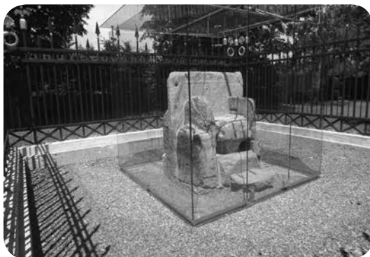
6. Vojvodski prestol, Vévodský stolec dnes

v kraji v blízkosti Bohinjského jezera a vodozávodu Savica. A historický děj poémy nabídne autorce možnost výkladu ohledně Karantánie jako říše tzv. alpských Slovanů, křtu Karantánců a vzniku starobylých „Frízinských památek“.