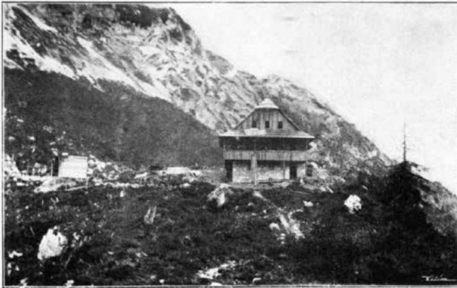
Česká chata na Ravném pod Grintovcem.