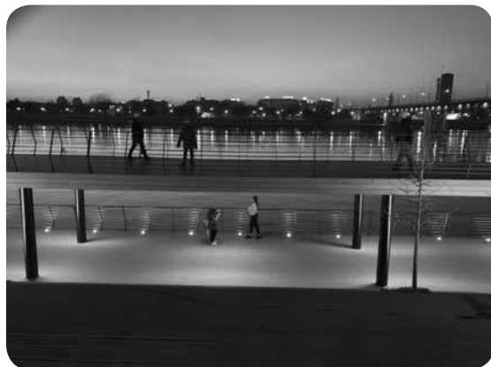
2. Promenáda u řeky Sávy, Bělehrad. 2021. Foto: Michal Pavlásek, 2021