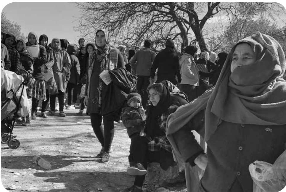
5. Ženy čekají někdy i celý den, až se na ně dostane řada a budou si moci pro svou rodinu vybrat oblečení dovážené neziskovými organizacemi. Ostrov Chios, 2020

Co je na registračním systému pro migranty a žadatele o azyl v Evropské unii podle tvého názoru nejproblématictější?