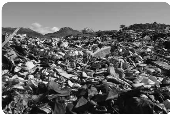
4. Tisíce uprchlíků připomíná i toto místo - jakýsi hřbitov záchranných vest na severu ostrova. Foto: Michal Pavlásek, Lesbos, 2020