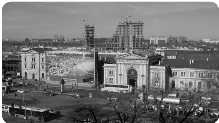
1. Budova bělehradského vlakového nádraží. Obří billboard avizuje proměnu města.