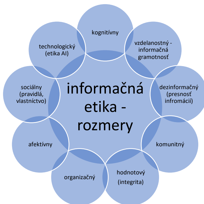
Obr. 3 Multidimenzionálny model etických výziev digitálnych informácií

Obsahové analýzy, výsledky analýz diskurzu diskusie a pojmové modelovanie nás viedli k spracovaniu modelov rozvoja informačnej etiky. Porovnali sme výsledky bibliometrických analýz, obsahových analýz a kvalitatívnej analýzy diskurzu diskusie expertov. Tematická diverzita a viacrozmernosť poukazuje na multidisciplinárnosť informačnej etiky. Preto sme z pojmových modelov tém a tém diskusie identifikovali multidimenzionálnu podstatu informačnej etiky. Budúcnosť rozvoja informačnej etiky v rámci trendov rozvoja výskumov informačného správania a informačnej vedy možno interpretovať najmä v kontextoch rozvoja digitálneho informačného prostredia a inteligentných technológií (etiky AI). Interpretáciu perspektív rozvoja informačnej etiky predstavujeme v multidimenzionálnom modeli informačnej etiky v kontexte predchádzajúcich pojmových reprezentácií etických výziev digitálnych informácií (obr. 3).