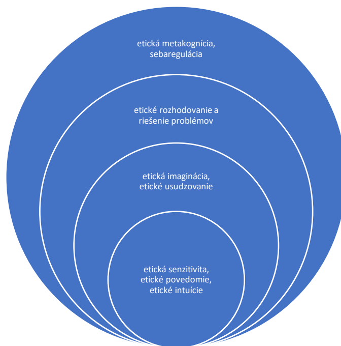
Obr. 4 Základné etické faktory informačných interakcií človeka