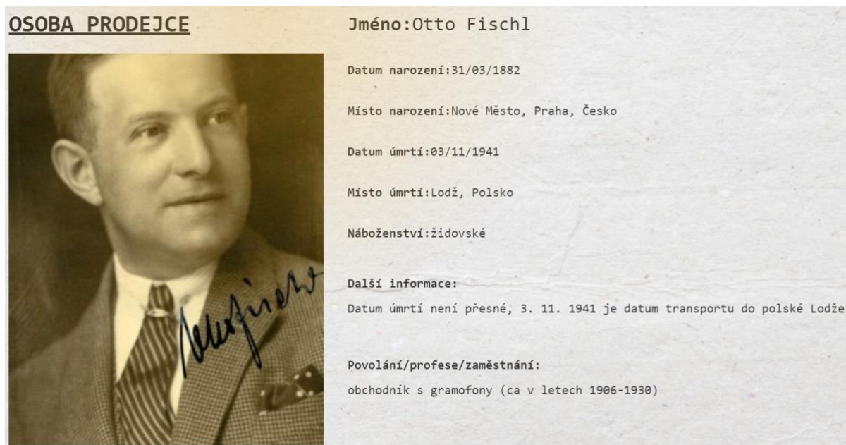
Obr. 3 Sekce Osoba prodejce v uživatelském rozhraní databáze

Sekce Rodina byla zahrnuta s cílem mapovat možné aktéřské sítě spojené s danou osobností. Některé osudy rodinných příslušníků mohou zajímavým způsobem doplňovat a dotvářet obraz biografie dané osoby, někteří členové rodiny mohli hrát klíčovou roli v podnikatelských aktivitách. Sekce Cestování byla motivována snahou ukázat geografickou mobilitu dané osoby, která měla mnohdy úzký vztah k jejím podnikatelským aktivitám (například návštěvou veletrhů, pracovním zaměřenými cestami apod.).