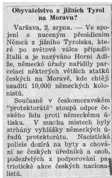
Obr. 3: Článek z československého zahraničního tisku (Svornost, Chicago) z 3. 8. 1939 informující o usazení jihotyrolských Němců na jižní Moravě.